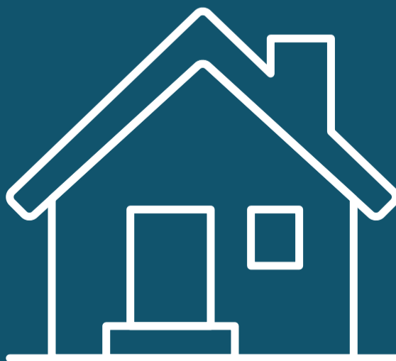
Hald deg heime om du er sjuk.

Være minst mogleg i kontakt med inventar og utstyr.