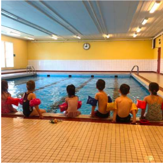
Barnehagen har fått midlar til symjeundervisning

dette året var at barnehagegudstenesta vart erstatta med julevandring for barnehageborna! Det var ei fin oppleving.