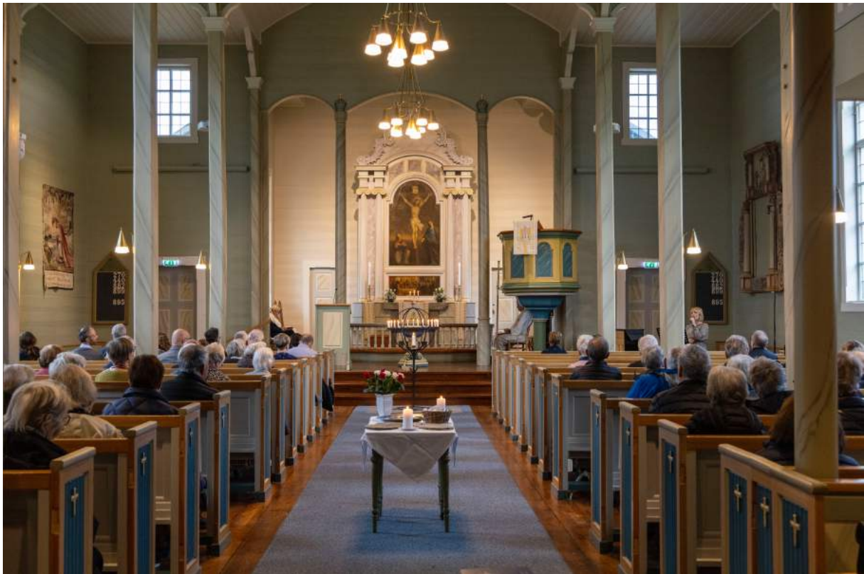
Gudstenesta helgemessesøndag

Diakoninemnda har ikkje konkrete planar om nye tiltak i 2023, men vil vera våken for å utvikla det arbeidet som alt er i gong. Ordninga med «Kaffitreff» på kyrkjegarden om sommaren vil verta utvida med nokre veker.