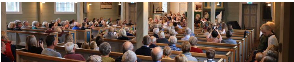
Familiegudsteneste Hausttakkefest med song av Barnegospel