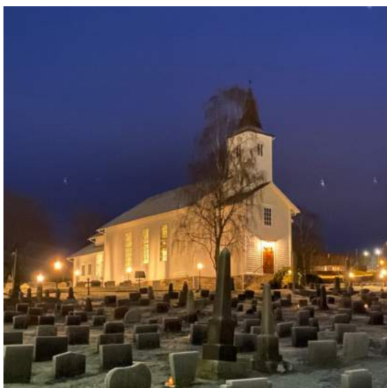
Kyrkja julaftan utan flaumljos, men med ledpærer i alle stolpane