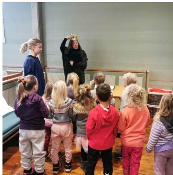
Julevandring med barnehagebarn