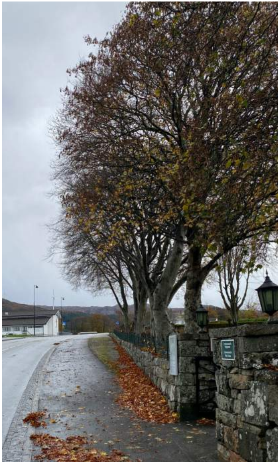
Trea lang fylkesvegen etter stell

I november vart dei gamle bøketrea attmed kyrkjegardsmuren langs Fitjarvegen stelt av "Tre og hage". Dei lange greinene har i mange år hange lågt over gravplassen og over fylkesvegen. Gjennom kroneløfting og sikring har trea fått det stellet som har vore heilt nødvendig. Det ligg også føre ein rapport som beskriv tilstanden for dei fleste trea på kyrkjegarden. Også kyrkjegardsarbeidaren har jobba godt med beskjæring og også fjerna nokre trær.