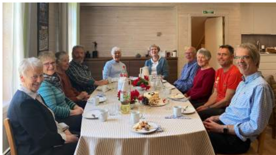
Dugnadsgjengen som var med i arbeidet med sakristia