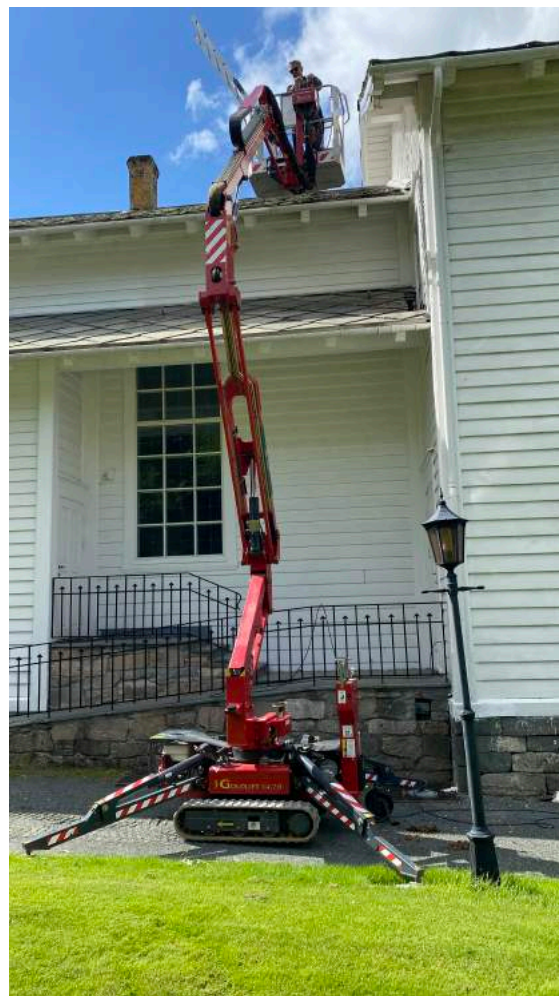
Med ulike lift vart kyrkja både vaska og måla

Utvendig vart heile kyrkja med både tårn og sakristia vaska og måla. Arbeidet byrja i mai og vart avslutta på seinsommaren. Det meste vart utført av kyrkjegardsarbeidaren, men også med god hjelp av dugnadsfolk. Kyrkja fekk låna lift og noko stillas. Kostnader med prosjektet vart såleis berre ein brøkdel av det som hadde vore tilfelle om arbeidet hadde vorte lagt ut på anbud.