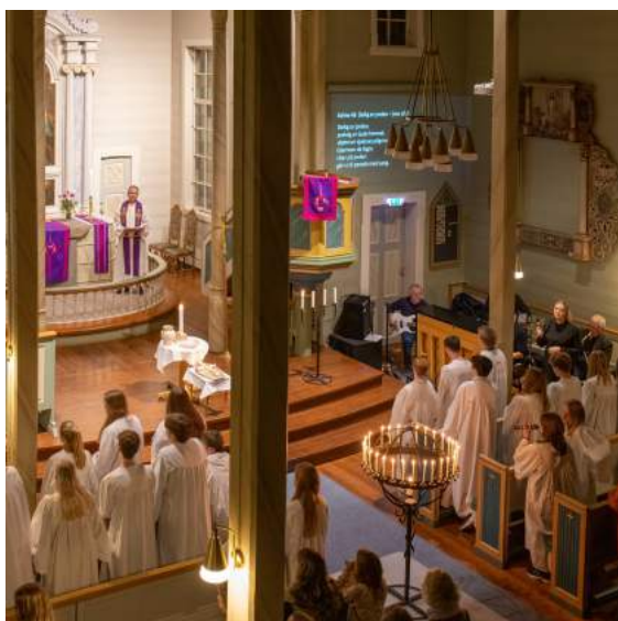
Lysmesse med konfirmantane