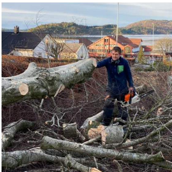
Eit bøketre ved porten i sør måtte også vika for parkeringsplassen

Asfaltering og steinsetjing og merking stod att ved utgangen av 2022. Det er plass til seks vanlege bilar og ein parkeringsplass er reservert for rørslehemma. Ein køyrar inn på plassen frå Sjøsbrekko. Me håpar at dei som treng kort gangveg frå bil til kyrkje eller gravplass, finn plass til å parkera her.