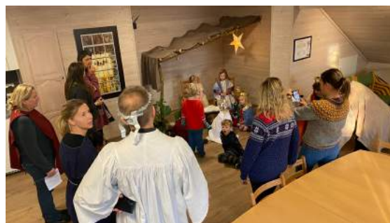
Julevandringar i Fitjar kyrkje - stallen på loftet

Til jul gjennomførte vi julevandring med barnehagane i staden for barnehagegudsteneeste. Alle barnehagane deltok og dei gav gode tilbakemeldingar på det som skjedde. Vi synst det var kjekt.