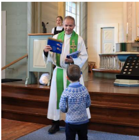
Frå 4-årsbok utdelinga – foto Ole Sandvik