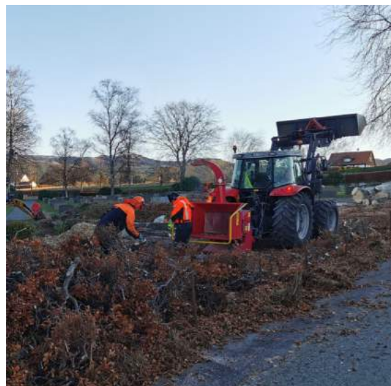
Dugnadsgjengen fjernar bøkehekken ved kyrkjegardshuset

Etter etableringa av miljøgata gjennom Fitjar sentrum blei moglegheita for å parkera attmed kyrkjegardsmuren borte. For fleire som oppsøker kyrkja og gravplassen, har det vore eit ønske om parkeringsplassar nærmare kyrkja. På slutten av fjoråret kom arbeidet i gang med å leggja til rette for parkering bakom kyrkjegardshuset. Her har det vore eit areal til parkering av traktor og gravemaskin og som deponi for overskuddsmassar. Hausten 2022 vart bøkehekken mot Sjøsbrekko fjerna på dugnad.