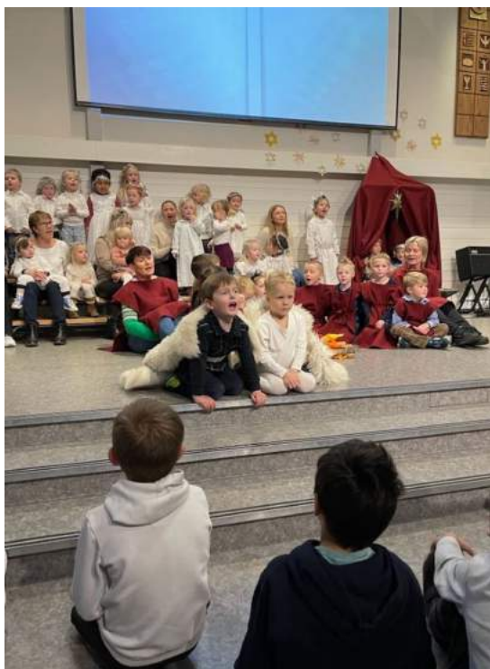
Frå vennskapsfesten på bedehuset