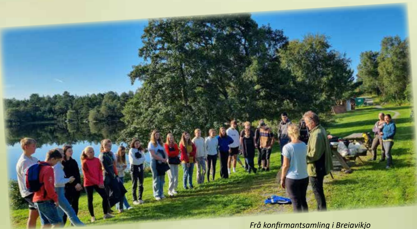
Frå konfirmantsamling i Breiavikjo