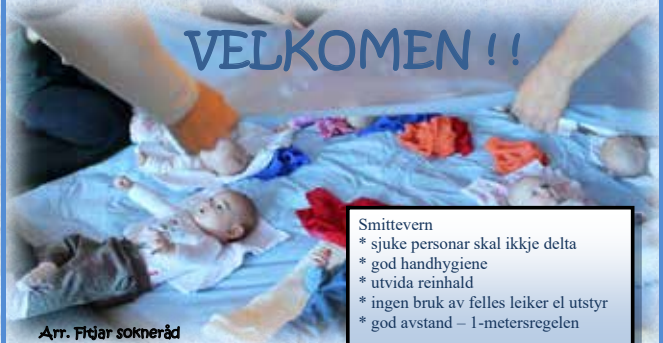
Arr. Fitjar sokneråd

Følg oss gjerne på facebook: Fitjar babysong og småbarnstreff