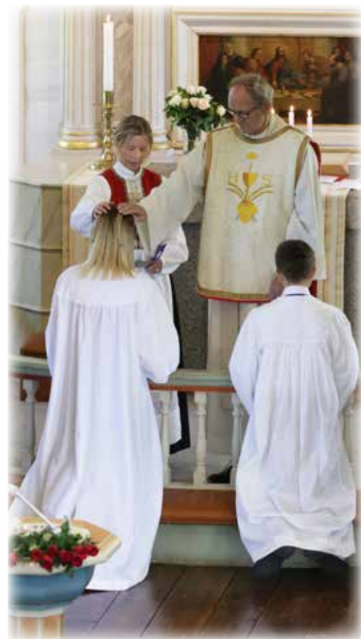
Frå konfirmasjonsgudsteneste 12.05.2019