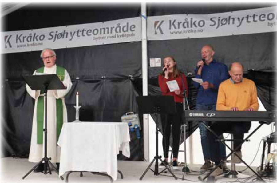
Frå friluftsgudsteneste i Kråko 19. juli