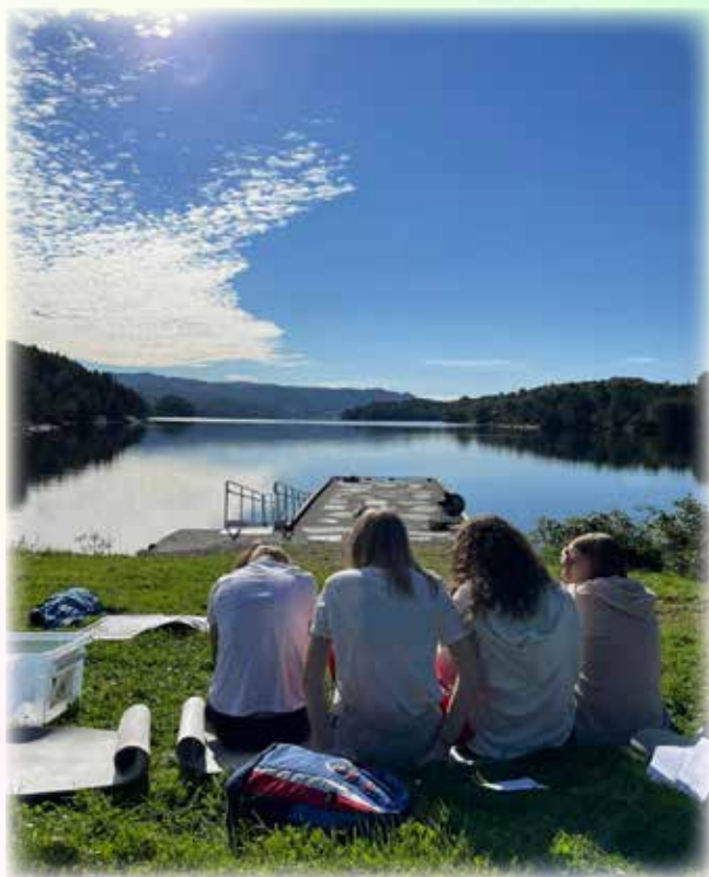
Konfirmantar i Breiavikjo med blikstille vatn og strålende sol!