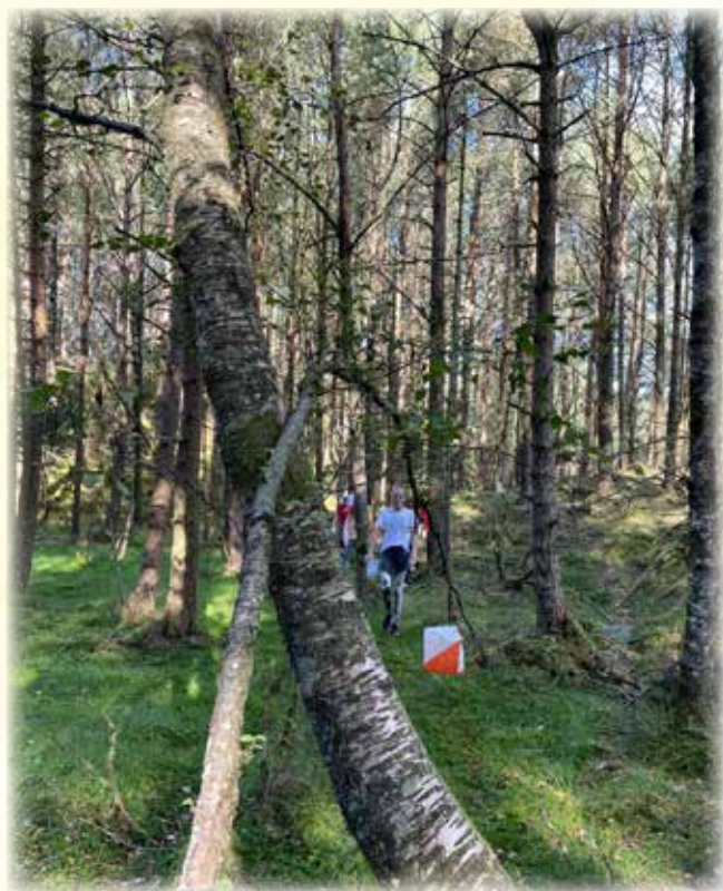
Med kart og kompass i skogen.