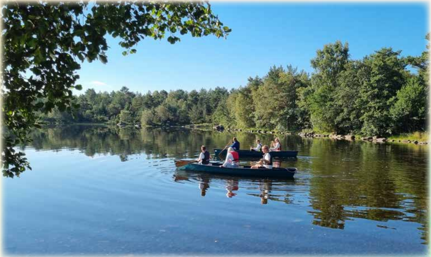
Perfekte forhold for kanopadling.