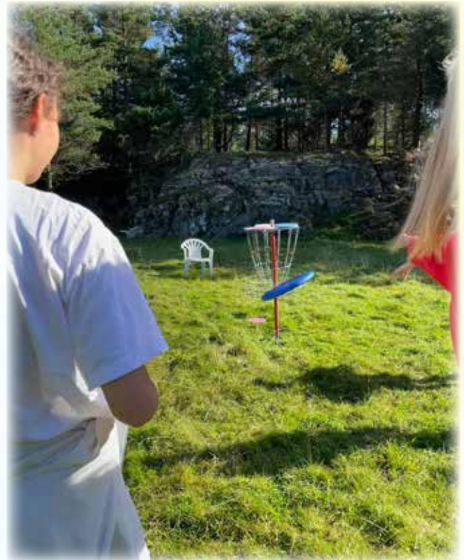
Frisbeegolf på Kjeneset: Av og til bommar me på målet, men då er det berre å prøve igjen!

Tusen takk for ein strålende dag på alle måtar.