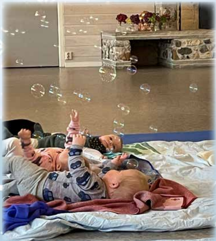
Såpebobler på babysong

Etter songstunda er det klart for nistekvelds. Når dei fleste har fått i seg litt mat, tar me fram duplo-klossane i midtgangen.