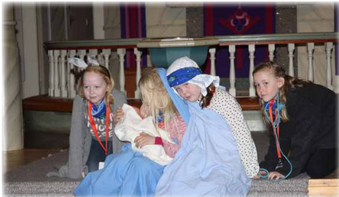
Josef og Maria på flukt.