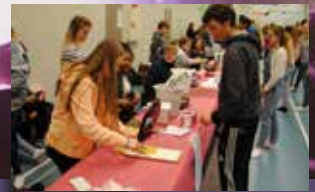
Blide og flinke vaffelsteikarar