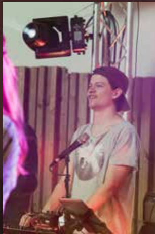
KYGO look a like

Dette året har nesten alle konfirmantane vore i Etne på leir! Det var over 400 andre konfirmantar der, og saman hadde me det kjempekjekt, sjølv om det vart litt mykje program og litt lite søvn. Det som gjorde størst inntrykk, var når ein tidlegare narkoman fortalte om livet inn og ut av rusavhengighet, og om korleis Jesus var med i livet. I tillegg lærte me masse om Guds kjærleik, og påskeevangeliet. Med andre ord ein veldig bra leir!