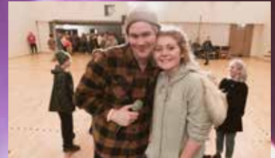
Vilde saman med den kule møteleiaren/presten

Indiamarked: Her kjøper me ting/tjenester av kvarandre, og pengane går til utdanning for indiske ungdommer.