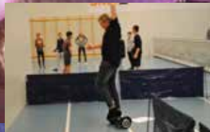
Skywalkeren stod aldri stille!