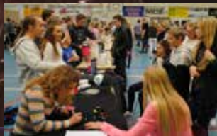
Skjønnhetssalongen vart ein suksess

Indiamarked: Her kjøper me ting/tjenester av kvarandre, og pengane går til utdanning for indiske ungdommer.