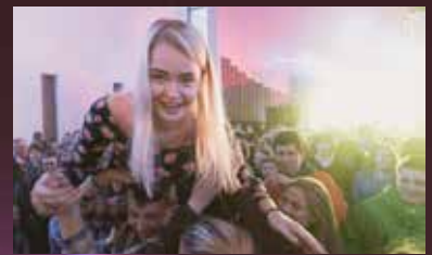
Emilie fekk prøve stagedive

Dette året har nesten alle konfirmantane vore i Etne på leir! Det var over 400 andre konfirmantar der, og saman hadde me det kjempekjekt, sjølv om det vart litt mykje program og litt lite søvn. Det som gjorde størst inntrykk, var når ein tidlegare narkoman fortalte om livet inn og ut av rusavhengighet, og om korleis Jesus var med i livet. I tillegg lærte me masse om Guds kjærleik, og påskeevangeliet. Med andre ord ein veldig bra leir!