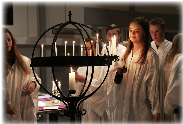
Frå lysmessa på Fitjar bedehus 27. nov.

Dersom du ynskjer skattefritak for gaver du har gitt til Fitjar kyrkje i året som gjekk, må kyrkjekontoret få melding om det så snart som råd.