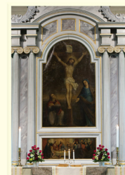
SÅ FAST EI BORG Fitjar kyrkje 150 år