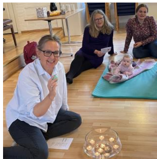
Babysong på Ljosheim

Babysong. Kyrkja hadde åleine ansvaret for babysong i 2022. Tidlegare har det vore i samarbeid med kommunen og kulturskulen. Det var samling føremiddagar hausten 2022. Til saman var 18 born innom, 15 mellom 0 og 1 år, og 3 over 1 år. For den yngste gruppa var det ein deltakingsprosent på 65, og for den eldste 16%.