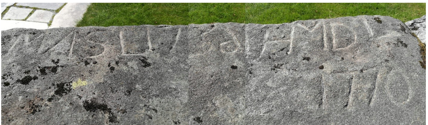
Slik ligg steinen på kyrkjegardsmuren. Vi ser at M og N er trekt i saman, det same med H og M. 6-talet i 1756 er spegelvendt.