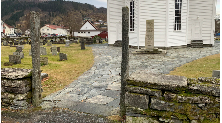
Den omtalte gravsteinen ligg øvst på kyrkjegardsmuren til høgre for porten.