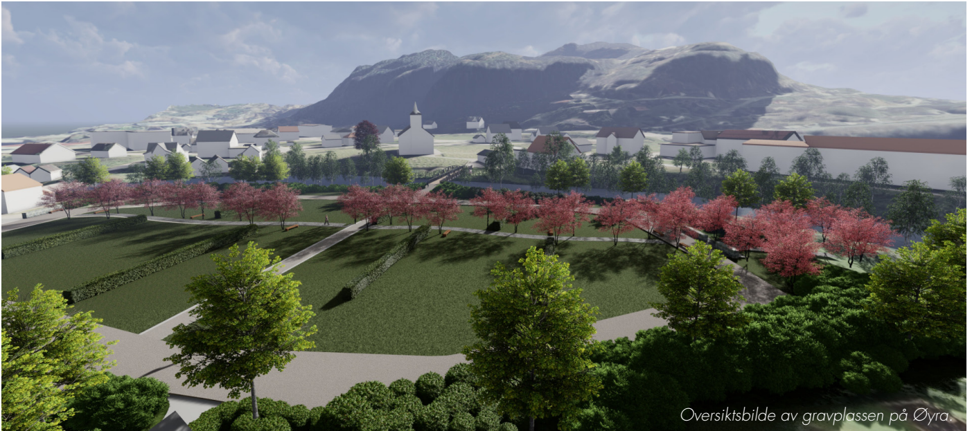
Oversiktsbilde av gravplassen på Øyra.

Det er styrkt håp om realisering av gravplassen på Øyra, men framdriftsplanen er usikker.