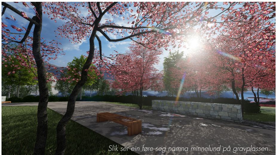
Slik ser ein føre seg namna minnelund på gravplassen.

Ved budsjetthandsaminga til kommunen i desember ligg Gravplass på Øyra inne i økonomiplanen med følgjande investeringar; kr 4 millionar i 2023 og 3,2 millionar i 2024. Brua over elva, frå kyrkja til gravplassen på