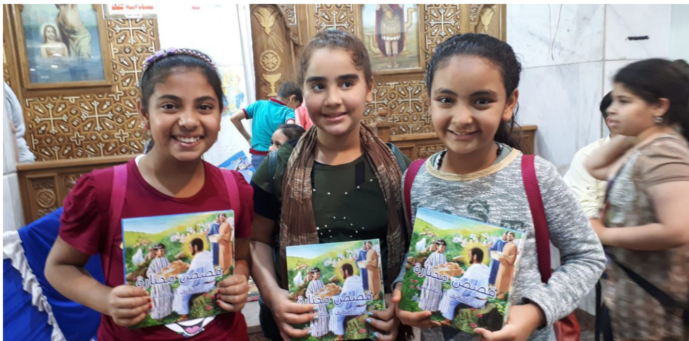
Utdeling av biblar til born i Egypt.