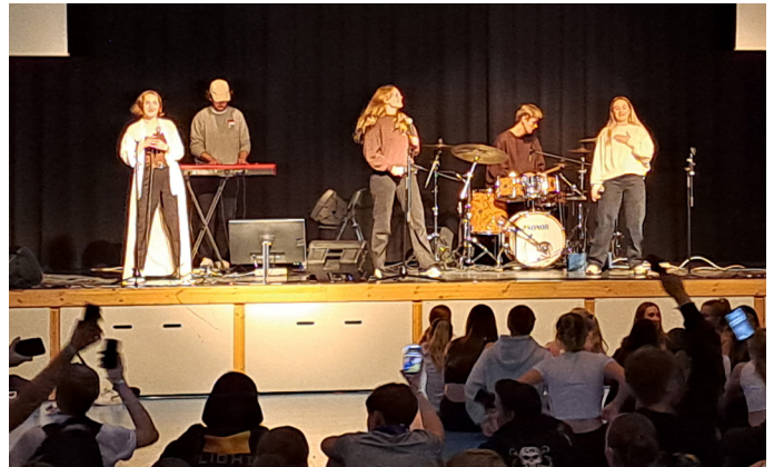
Det var konsert, song og gudsteneste på festivalen.

Konfirmantane var med på ulike aktivitetar som dei hadde valt sjølv, mellom anna dans, drama, vektløfting, gaming/FIFA, friluftstur og førstehjelp. Det blei arrangert ei innebandyturnering, og festivalen blei avslutta med konsert og gudsteneste.