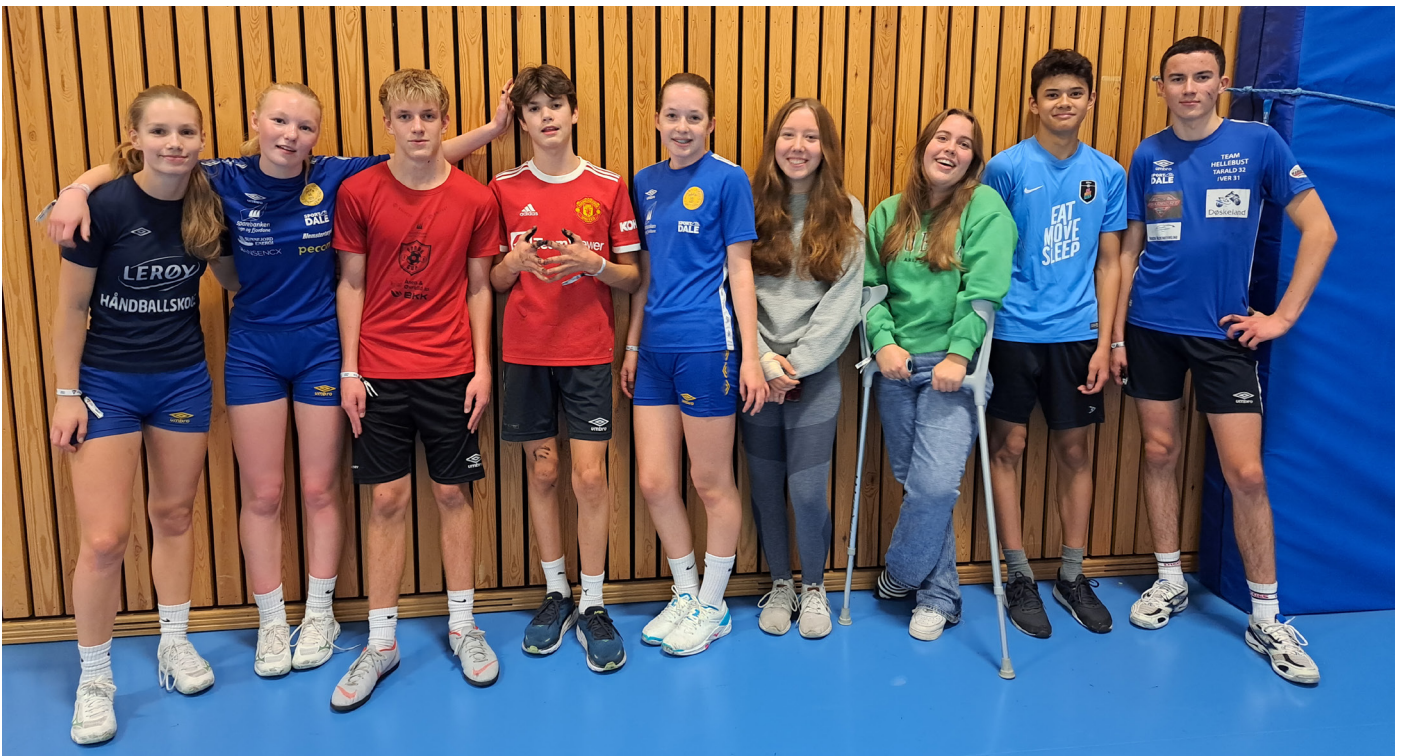
Fjaler sitt innebandylag gjorde ein god innsats i turneringa, og nådde nesten finalen.