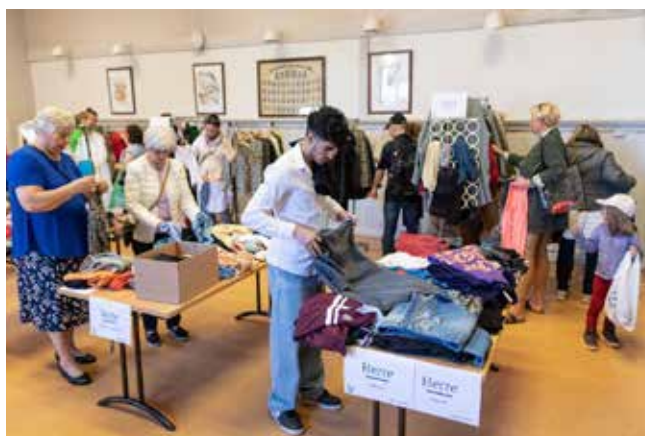
Fra en klesbyttedag i den gamle kinosalen på Selbak

Det er 21 lokalsamfunnsutvalg i Fredrikstad. Lokalsamfunnsmodellen ble i Bystyret 05.09.2019 vedtatt å være en nærdemokratimodell, nært knyttet til kommuneorganisasjonen. Ordningen skal bidra til god dialog mellom innbyggere, folkevalgte og administrasjon. Lokalsamfunnsutvalgene skal tilrettelegge for dialog i lokalsamfunnene og gi innspill til kommunale planprosesser og høringer.