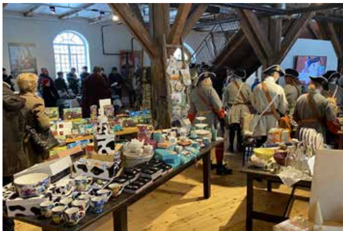
Folksomt på Fredrikstad museum. Bilde fra forsvarshistorisk dag tatt fra museumsbutikken