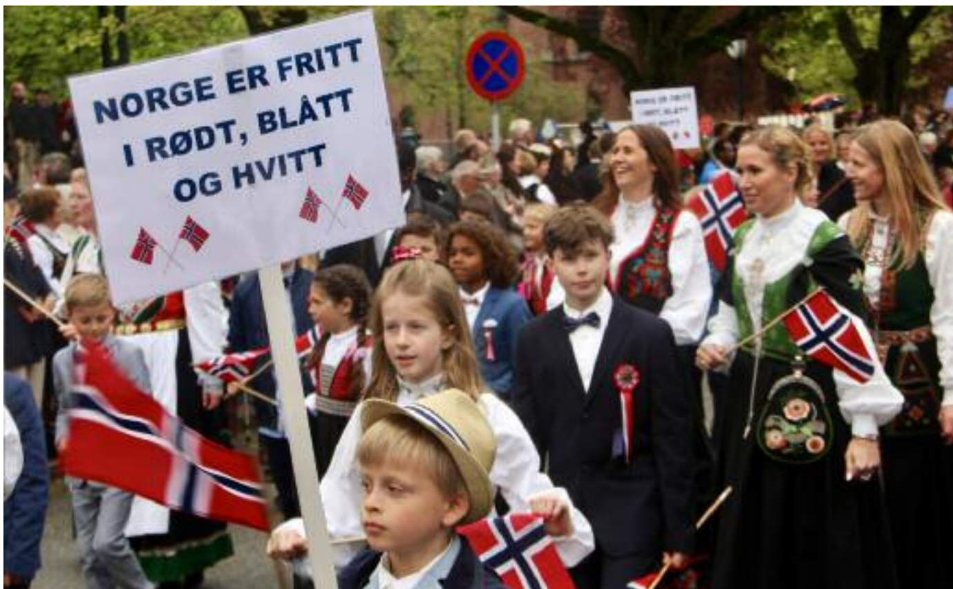
Slik så det ut i fjorårets 17. mai-parade. Her er de fire symbolene frihet, fred, fellesskap og flagg godt representert.