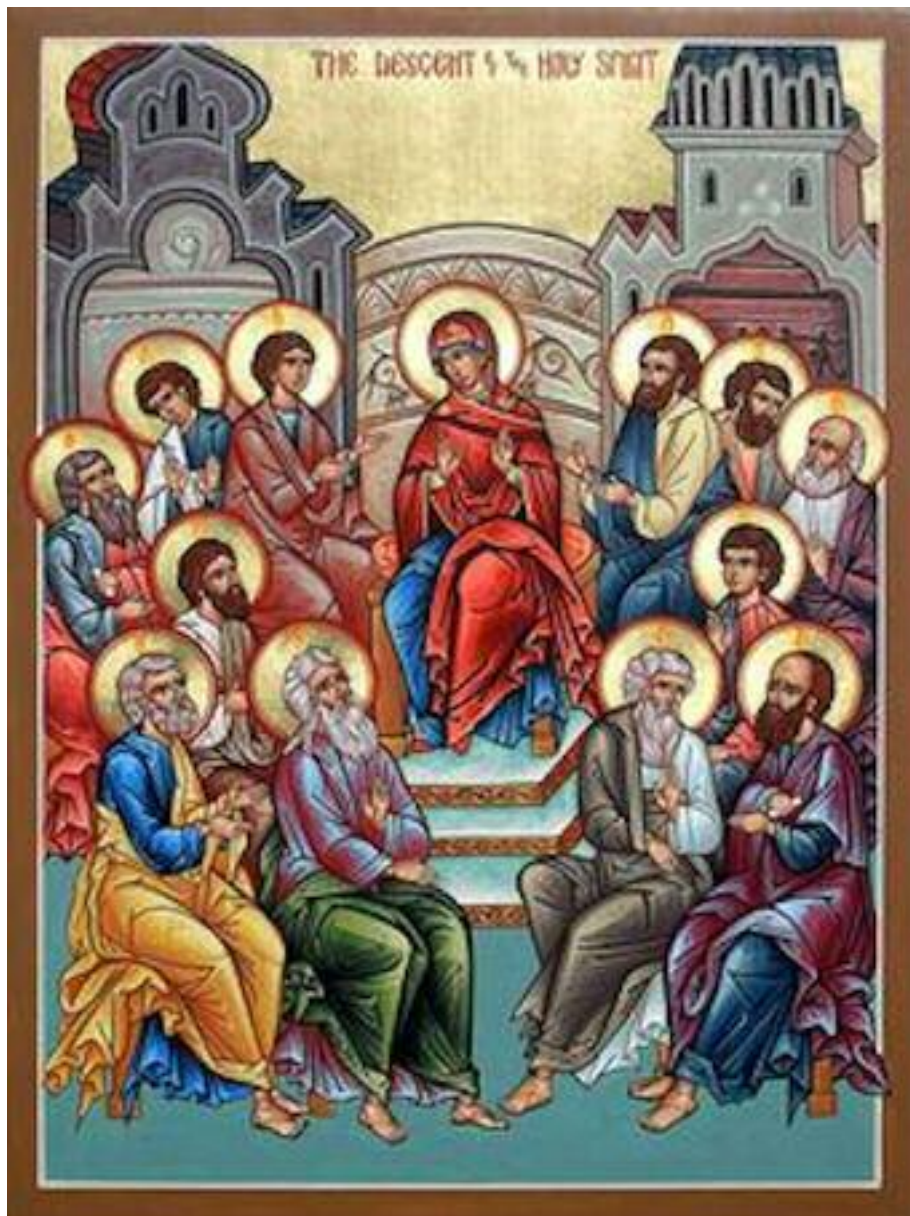
Den Hellige Ånd faller over Jesu disipler. Moderne ortodoks ikon, av Matthew Garrett.

Domkirken og Fredrikstad Metodistmenighet er enige om å vedlikeholde avtalen om «Nådens fellesskap» fra 1997. Det holdes to felles gudstjenester, på våren i Metodistkirken og om høsten i Domkirken.