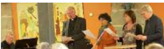
”Vaske her og vaske der” sang domkirkestaben under avskjedsarrangementet i kirkekjelleren.