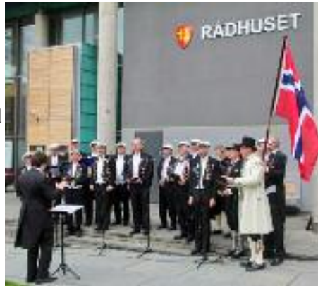
Fredrikstad Mandssangerforening fotografert 17. mai i fjor.

Onsdag 25. juli Programmet er ikke fastsatt.