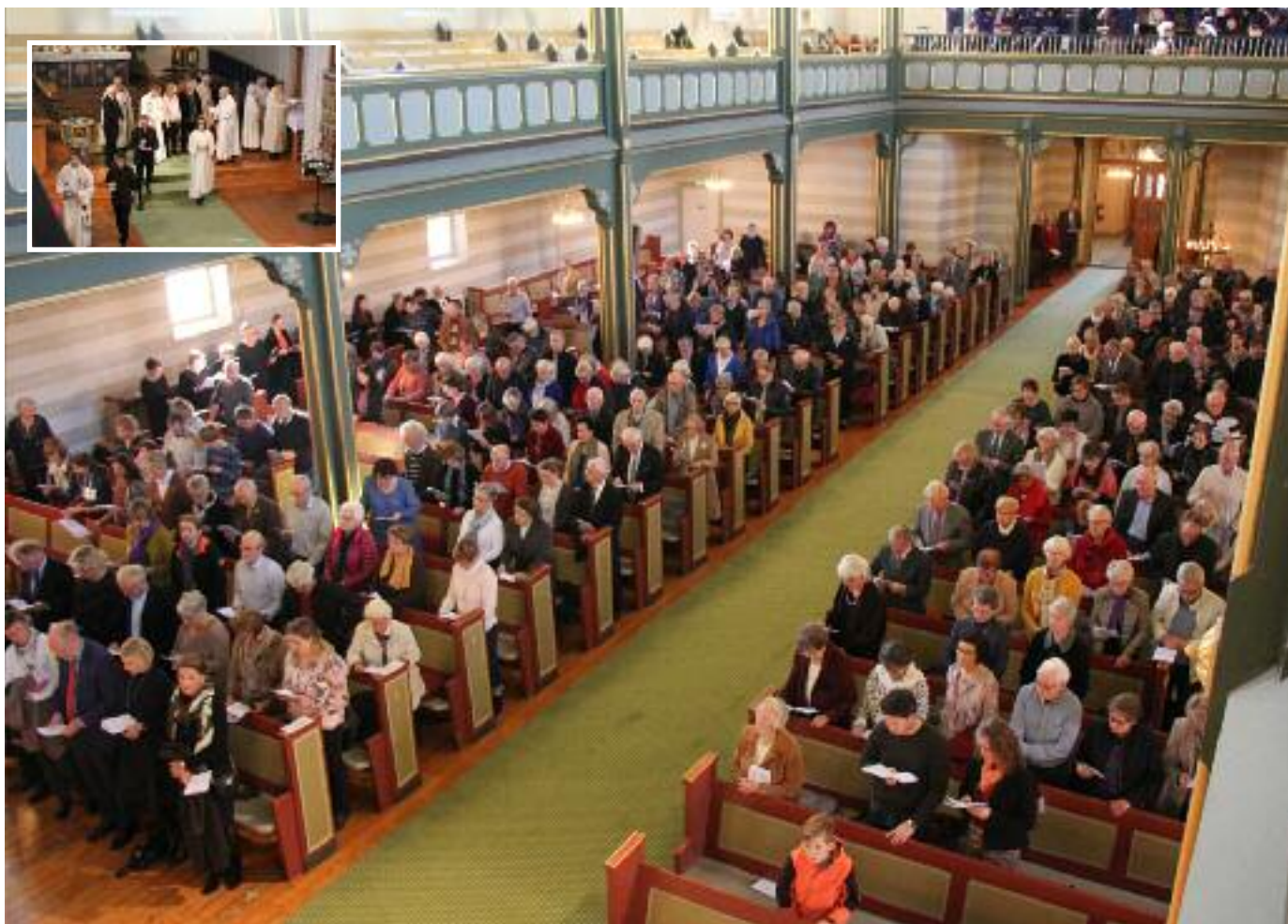
Det var tett i benkeradene da Martin Luther og Reformasjonen ble feiret i Domkirken i fjor høst. Innfelt: Prester og andre ledere fra øvrige menigheter deltok under nattverden.