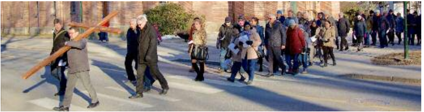
LANGFREDAG Nær 60 deltagere stilte opp i årets korsvandring i Fredrikstad. Her er prosesjonen på vei fra St. Birgitta katolske kirke via Domkirken mot sentrum. Som i tidligere år er korsvandringen et økumenisk tiltak mellom Fredrikstad Kristne Råd og Kirkenes Bymisjon.