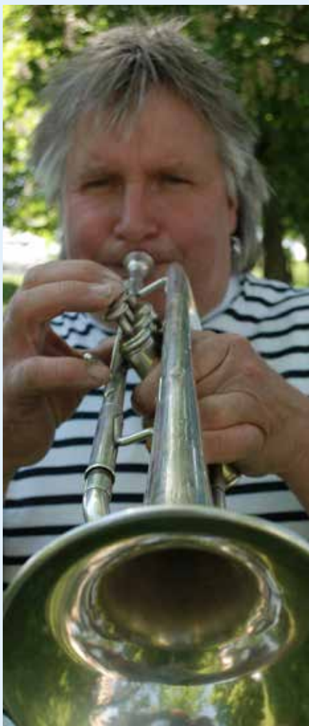
Trompeten er Arnes følgesvenn. Han spiller i mange sammenhenger, også i kirken.

Dermed blir Skandinavias største modelljernbaneanlegg enda større. Og senteret som har etablert seg som et av Østfolds mest populære severdigheter, vil utvilsomt lokke til seg enda flere fra fjern og nær. Her massevis med loko-