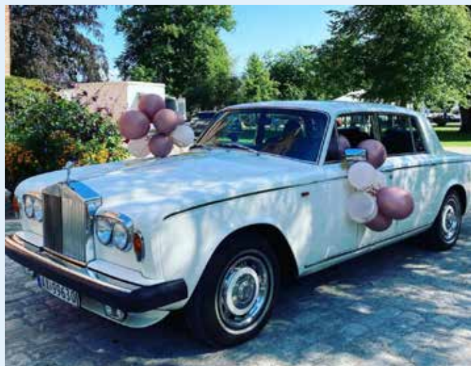
Denne staselige bilen sto klar for å frakte film-brudeparet til nye eventyr.