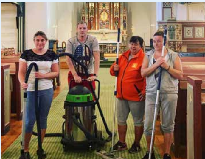
Rengjørerne fra Viuno sørget for at kirken ble gjort ren og pen etter innspillingen.