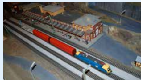
Lokomotiver, personvogner og godsvogner langs et imponerende nett med skinnegang.

Märklin-tog. På senteret i dag ruller det fortsatt Märklin.