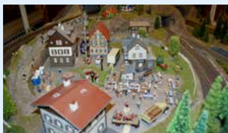
Detaljene i landskap og bymiljøer i modelljernbanesenteret er fascinerende.

fra skinnegangen. Den egenskapen har ikke andre likestrømslokomotiver, sier Børresen.