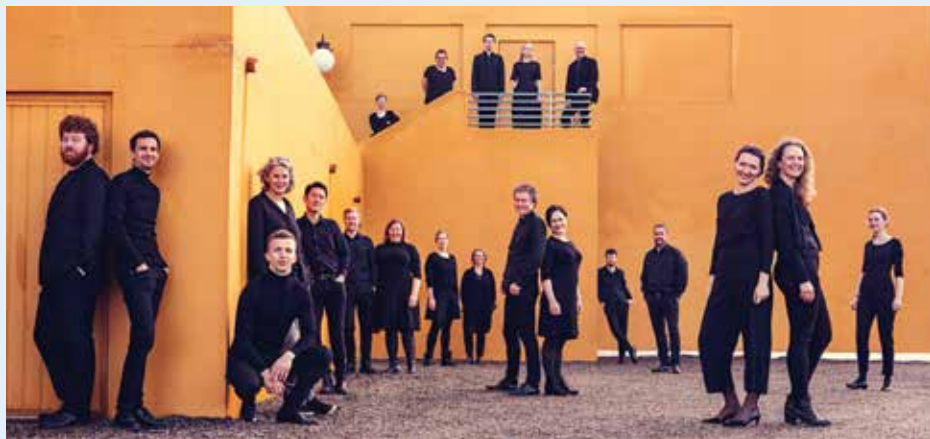
Det Norske solistkor gjester Hovland-festivalen også i år. For mange er dette årets høydepunkt. Koret synger i Domkirken fredag 22. oktober.