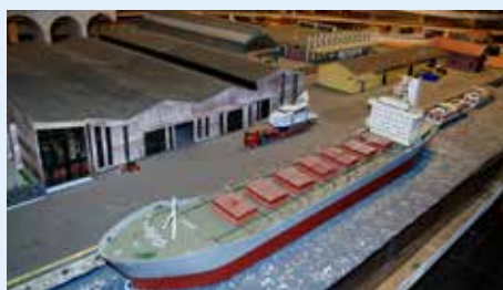
En tro kopi av travle Øra med skip, kraner og lagerhaller skal på plass.