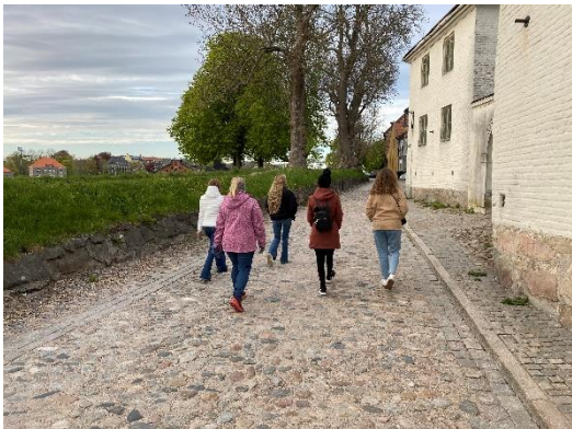
Jentegruppa på stolpejakt

Vi har fått et nytt diakoniutvalg i Glemmen og Gamle Glemmen, og selv om det har vært lite oppdrag på disse flotte folka i 2020, er det en ressurssterk gjeng som er klare til å bidra når det trengs.