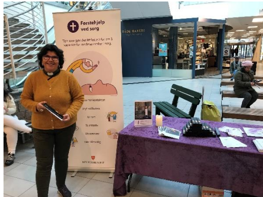
Sorgkampanje i Torvbyen