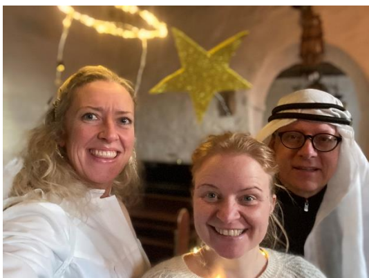
Julevandring for barnehager