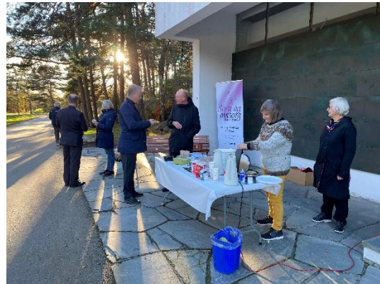
Vaffelserving på Leie på Allehelgen

Allehelgenskampanjen i høst var veldig fin å få være med på. I tillegg til å dele ut lys i Torvbyen som vi har gjort i flere år, hadde diakoniutvalget ansvaret for åpent kapell på Leie, hvor man i forkant av minnegudstjenesten kunne sitte litt i kapellet, tenne lys og lytte til musikk. I tillegg lagde vi en liten stand utenfor hvor vi serverte vafler og kaffe, delte ut lys og pratet med de som gikk forbi. Mange var på gravlunden for å tenne lys hos sine. I tillegg kom Slettevold gartneri med et lite utsalg av gravlys, bar og kranser. Dette var veldig positivt, så vi ønsker å gjøre dette også i 2023.