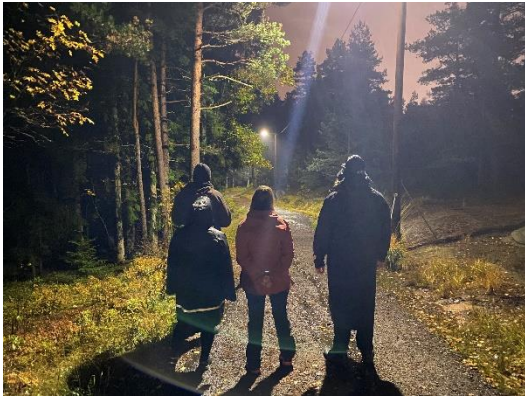
Gå for å leve

Vi har i flere år deltatt i samarbeidet med andre trossamfunn som handler om selvmordsforebygging, via gruppen som heter Håp i mørket. Nytt i 2022 var enda et samarbeid gjennom organisasjonen Leve (Landsforeningen for etterlatte etter selvmord) og den nye organisasjonen Gå for å leve. Dette har resultert i et lavterskeltilbud hvor vi møtes en gang i uken for å gå tur sammen. Målgruppen er egentlig alle, enten en trenger noen å gå tur med, ønsker å være med på å sette fokus på en viktig sak, eller er berørt på andre måter.