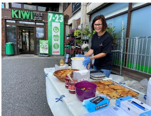
Vaffelserving på Kiwi