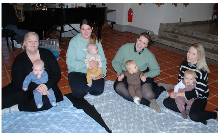
Her er det felles sang på matter på kirkegulvet i Glemmen. De små følger nøye med på både sanger og pianomusikk.

Midt på kirkegulvet i Glemmen kirke er det lagt matter og tepper. Her sitter fire mødre med hver sin baby, og synger kjente og kjære sanger. Det er tid for babysang. Hver torsdag formiddag deltar de i en opplevelsrik samling. Og foreldre får ta del i et givende fellesskap, blir kjent med andre og kan bygge relasjoner.