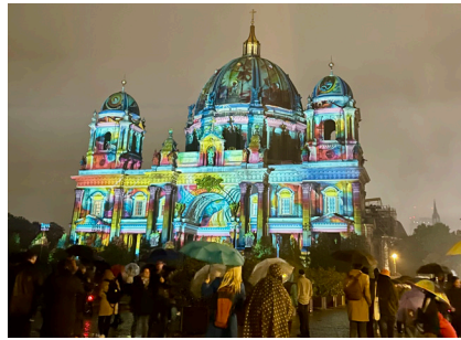
I oktober opplevde jeg lysfestival i Berlin. Motivet viser imponerende Berliner Dom, opplyst i flotte farger!