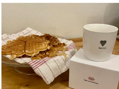
Varemerke for Sjømannskirken. Det serveres ferske vafler og kaffe i Berlin-kopper på leseværelset.