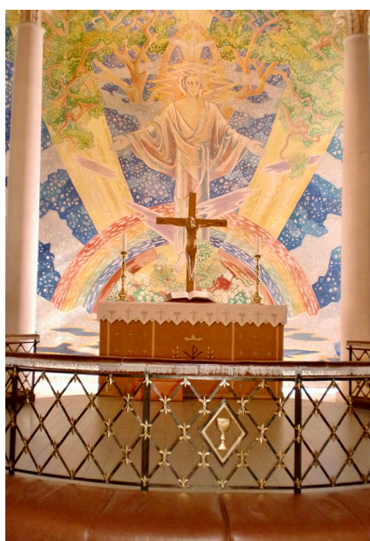
Glemmen kirke har gudstjenester hver søndag kl 11.00.