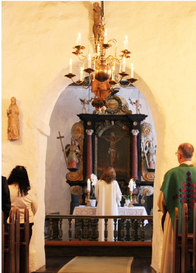
Sokneprest i Glemmen og Gamle Glemmen Hege Fagermoen ved alteret under gjenåpningen av den ærverdige kirken fra 1182.