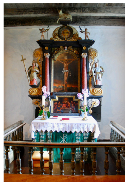
Gamle Glemmen kirke har gudstjenester hver søndag kl 11.00.