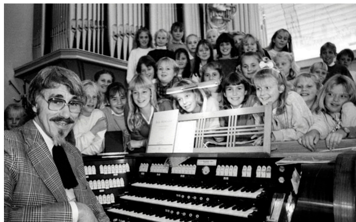
Egil Hovland var blant annet kjent og kjær i Fredrikstad for sitt engasjerte arbeid med barnekor i Glemmen kirke.