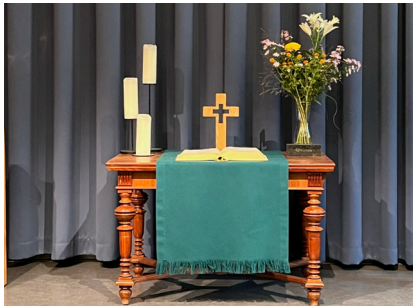
Sjømannskirken har to stasjoner (kirker) i Tyskland, Berlin og Hamburg. Her ser vi alteret i Berlin.