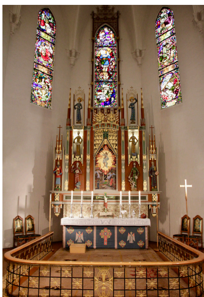
Domkirken har gudstjenester hver søndag kl 11.00.