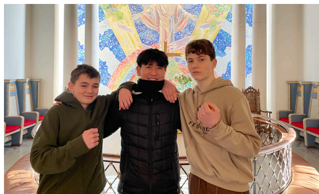
I år er det 19 konfirmanter i Gamle Glemmen og 88 konfirmanter i Glemmen kirke. Her er tre av dem.

- Hva er det viktig for konfirmanntene å få med seg fra undervisningen?