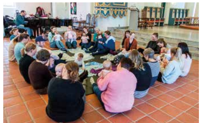
Alle sitter på matter på gulvet under sangstunden.