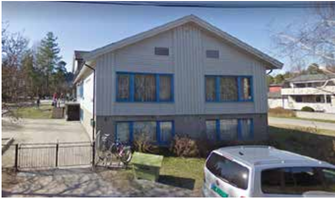
Menigheten disponerer fremdeles hele underetasjen på Lyngmo.

I januar i år ble salgskontrakten for menighetens eiendom i Labråten 76 undertegnet mellom Glemmen menighetsråd og Ådalen Barnehager. Dermed settes sluttstrek for et år med forhandlinger, der det helt til slutten av desember kunne se ut som om partene ikke skulle bli enige.