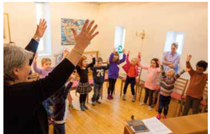
Minores øver i Mariakapellet.