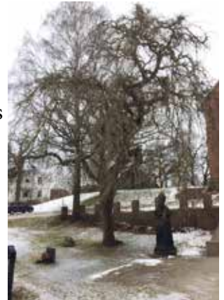
Sørgeasken ved trappen opp til kirken.