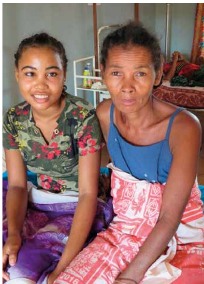
Disse to kvinnene er blant de heldige som får operasjon.

– Jeg har vært mye plaget av skamfølelse. Inni meg kjente jeg en redsel for å bli avvist av mine venner,