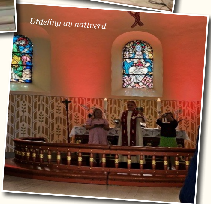
Utdeling av nattverd