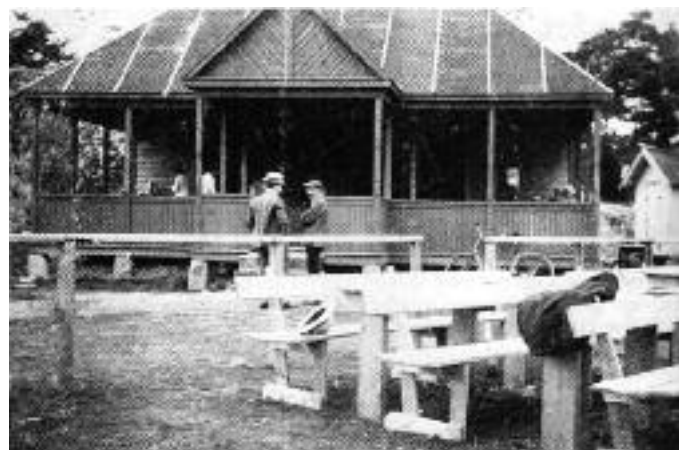
Enhus på 20-tallet -

Det 27 mål store friområdet skulle ha noe å tilby de fleste. Her er fine svaberg, myke gressmatter, badestrender, flytebrygger, flåter og badetrapper. Det er også mulig å finne lune plasser og trær som gir skygge. I årtier har Enhus vært en samlingsplass for badeglade barn og voksne. Kvaliteten på vannet er bedret mye de siste årene - og avhengig av vindforholdene kan det være veldig bra. Fra utsikten i sør ses Rødsholmen - Glufsa. Ellers går Kyststien forbi Enhus.