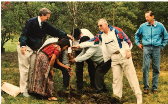
Planting av vennsapsstre på Kråkerøy.

Skole-skole kontakten har vært og er en bærebjelke i vennsapskontakten. Flere skoler i Fredrikstad samler inn penger som går til stipend til elever i våre vennsapsbyer i Guatemala. Skolegruppa har etablert «Omvendt julekalender» med eget informasjonsmaterieell lærerne kan bruke i undervisningen. I desember 2019 var klasser ved Begby, Gudeberg, Hurrød, Rødsmyra, Kråkerøy ungdomsskole og Kvernhuset med. Trosvik skole arrangerer også markedsdag for stipendprosjektet. Kr 90.200,- er i januar 2020 sendt til fordeling på 76 stipender á kr 1.200,- til elever i skoler i San Marin og Patzun!