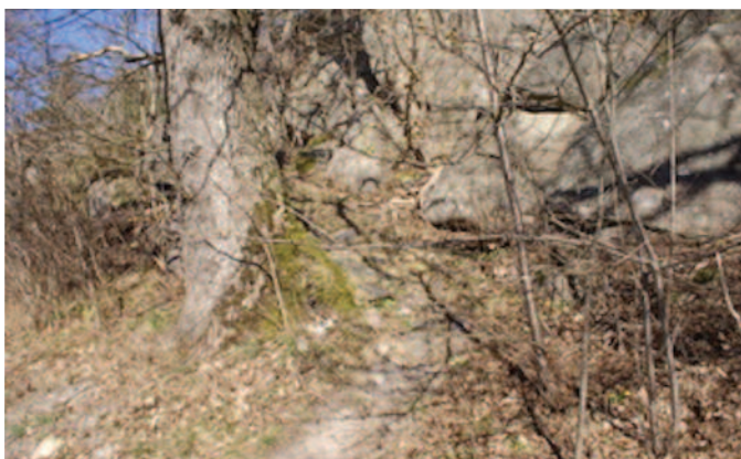
Stien opp til Grotta starter ved Rødssvingen.

Jeg vil begynne med stien over «Grotta».