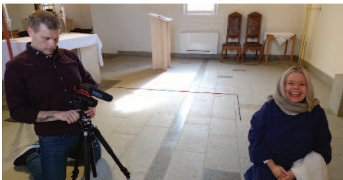
Nå driver vi også med videoproduksjon

Det ble en bratt læringskurve for mange av oss i Kråkerøy menighet. Vi har laget andakter, babysang, gudstjenester, Krølle-klubb, Skumrings, konfirmantundervisning og mye annet som er lagt ut på Instagram, Facebook og YouTube. Vi har måttet finne alternative måter å møtes på, med mer og mindre hell. Et godt eksempel var vel da vi brukte 40 min på å få koblet oss sammen til menighetsrådsmøte.