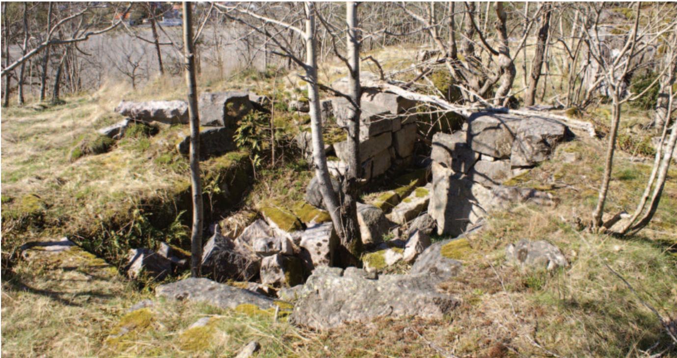
Restene av bygningen som ble kalt «Grotta». Foto 2020.

En dag stakk jeg handa inn under stenen, og da fant jeg en fyrstikkeske. Med spenning åpnet jeg den. Inne i lå det en lapp med en påskrift. «Møt meg kl. 1900».