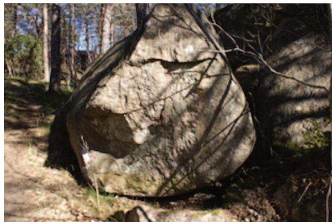
Stenen der de hemmelige beskjedene var gjemt.

Dette lille lagerhuset ble kalt for «Grotta», og siden ble det navnet på et større område. Siden stedet ligger høyt og fritt og med mye sol og varme, var det nok et godt egnet sted for å ha et gartneri. Det ble også anlagt en enkel sti dit opp for å gjøre det lettere tilgjengelig. Min mormor, som var født i 1890, fortalte meg at som ung hendte det at de gikk fra byen og ut til dette gartneriet for å kjøpe varer.