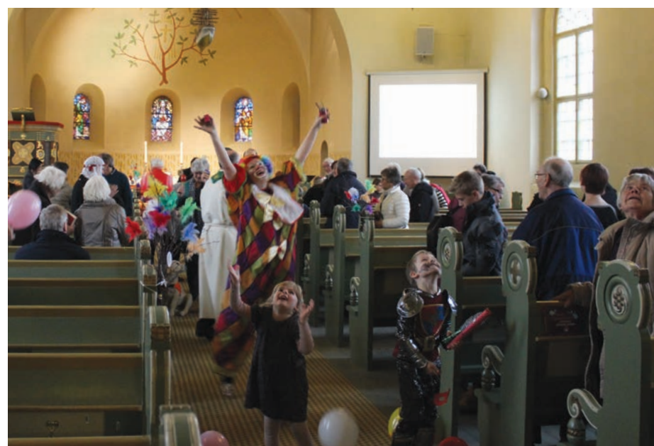
Under: Kirken var vakkert og fargerikt pyntet med fastelavnsris.