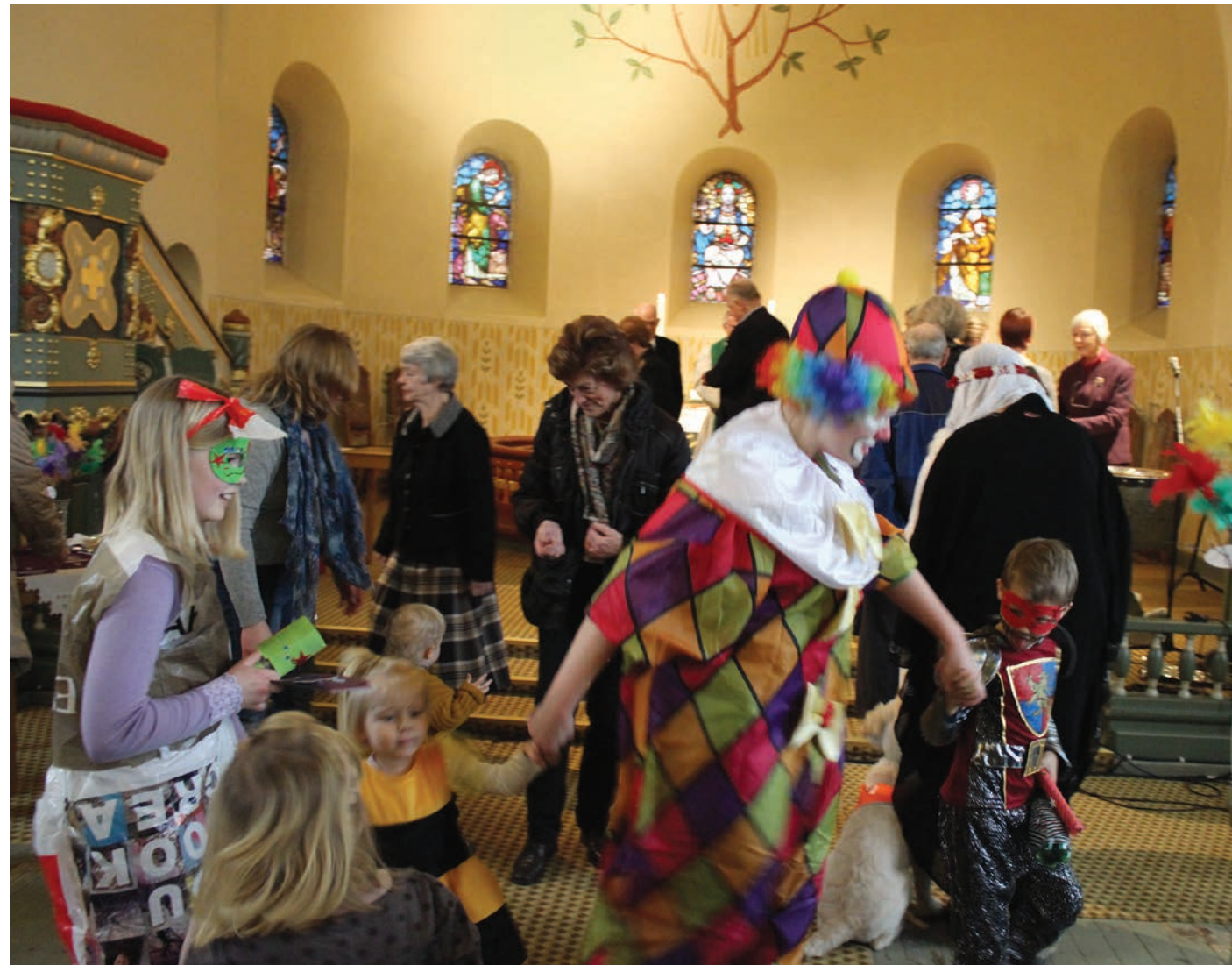
Karnevalgudstjenesten ble en fest og glede for både store og små.

Søndag 15. februar var det fastelavn og vi hadde karnevalgudstjeneste i kirka for aller første gang.