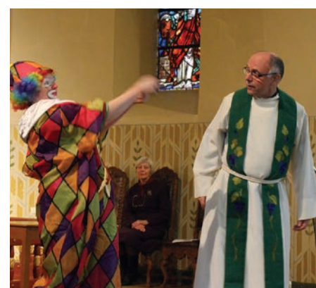
Øverst: Kid Sing bidro med sang og musikk.