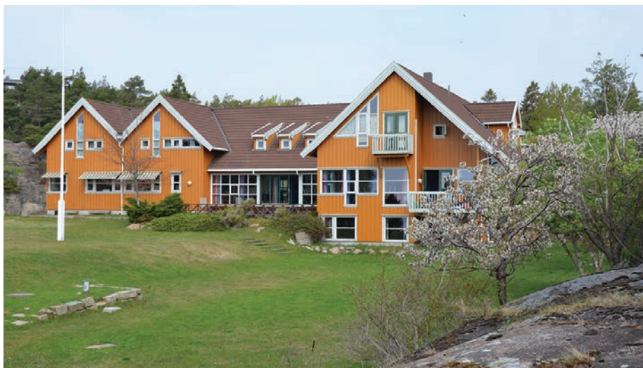
SAUEVIKA: Herligste sted på jord...synges det i leirsangen. Mange er enige i nettopp det og tilbringer deler av sommeren her ute.

TJELLHOLMEN: Stedet mange av Kråkerøys barn, unge og voksne har et sterkt og kjært forhold til.