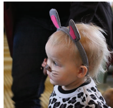
Under: En liten leopard var også med.