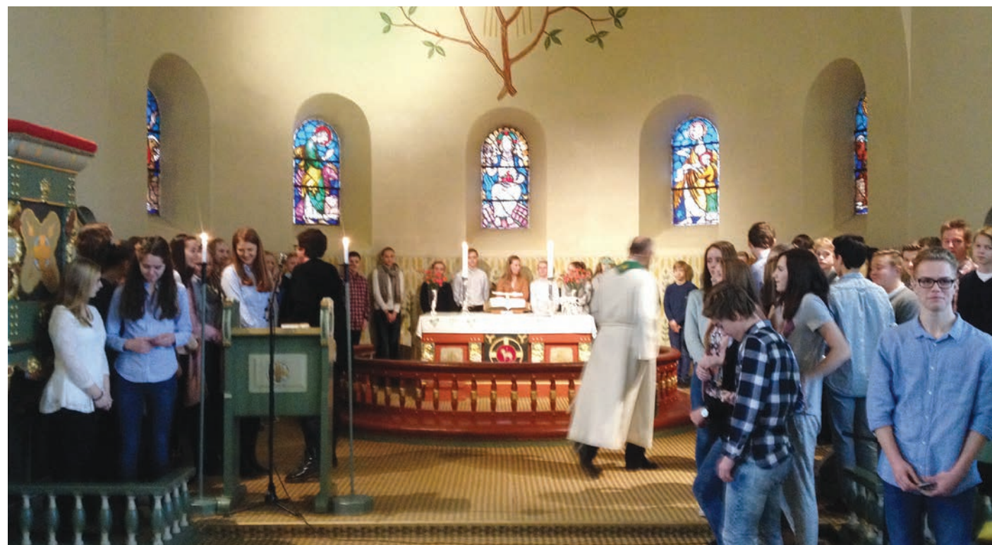
Årets konfirmantkull ble presentert for menigheten.