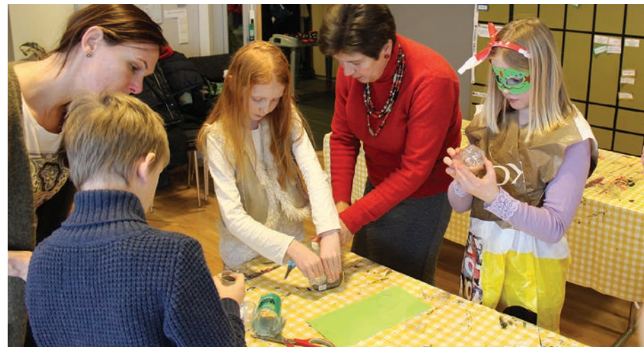
Forberedelsene er igang: Små og store lager rytmeinstrumenter til karnevalgudstjenesten.