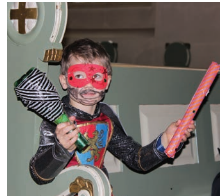
Over: En ridder med hjemmelagde instrumenter.