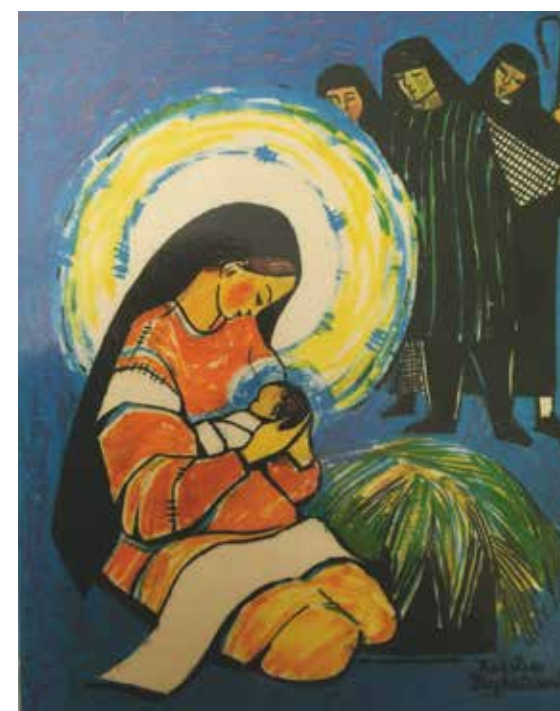
Maria med Jesusbarnet. Malt av den finske kunstneren Kerstin Frykstrand. Trykket med tillatelse fra Norges kristelige skoleungdomslag