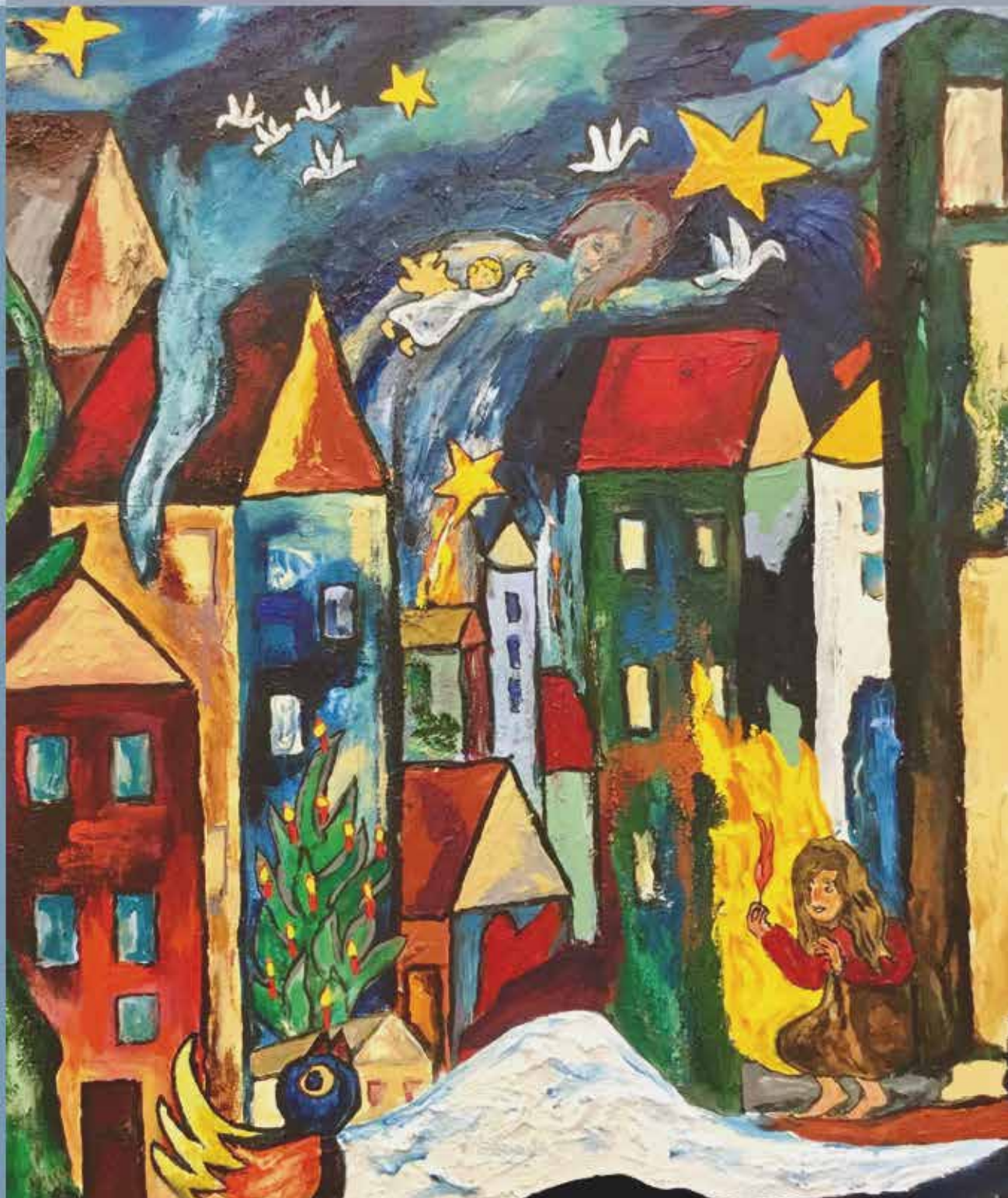
«Piken med svovelstikkene». Malt av den danske kunstneren Finn Jakobsen