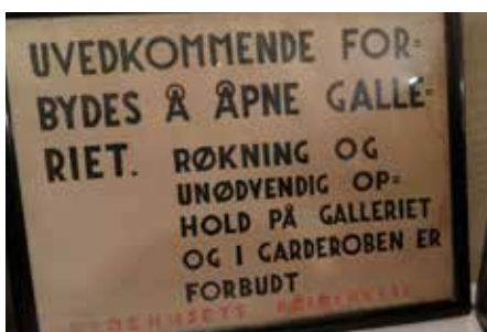
Noe leven på galleriet skulle det ikke være!