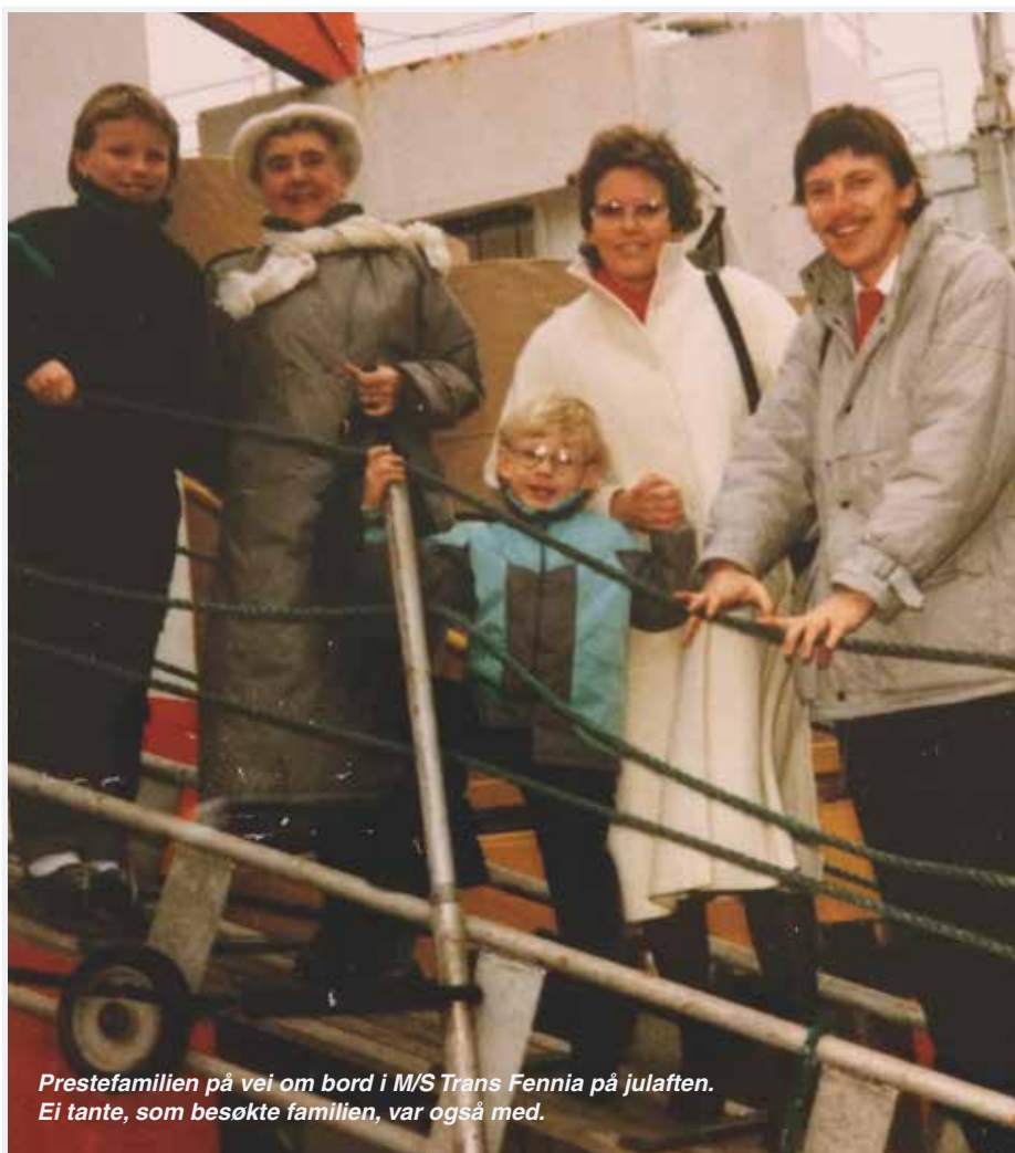
Prestefamilien på vei om bord i M/S Trans Fennia på julaften. Ei tante, som besøkte familien, var også med.

”Farende folk” – som besøkte sjømannskirken, stoppet alltid opp i