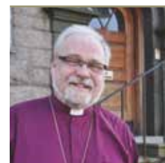
Atle Sommerfeldt Biskop