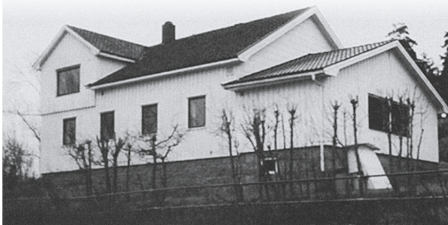
Bildet er hentet fra bygdeboken: "Kråkerøy – en østnorsk kystbygd".