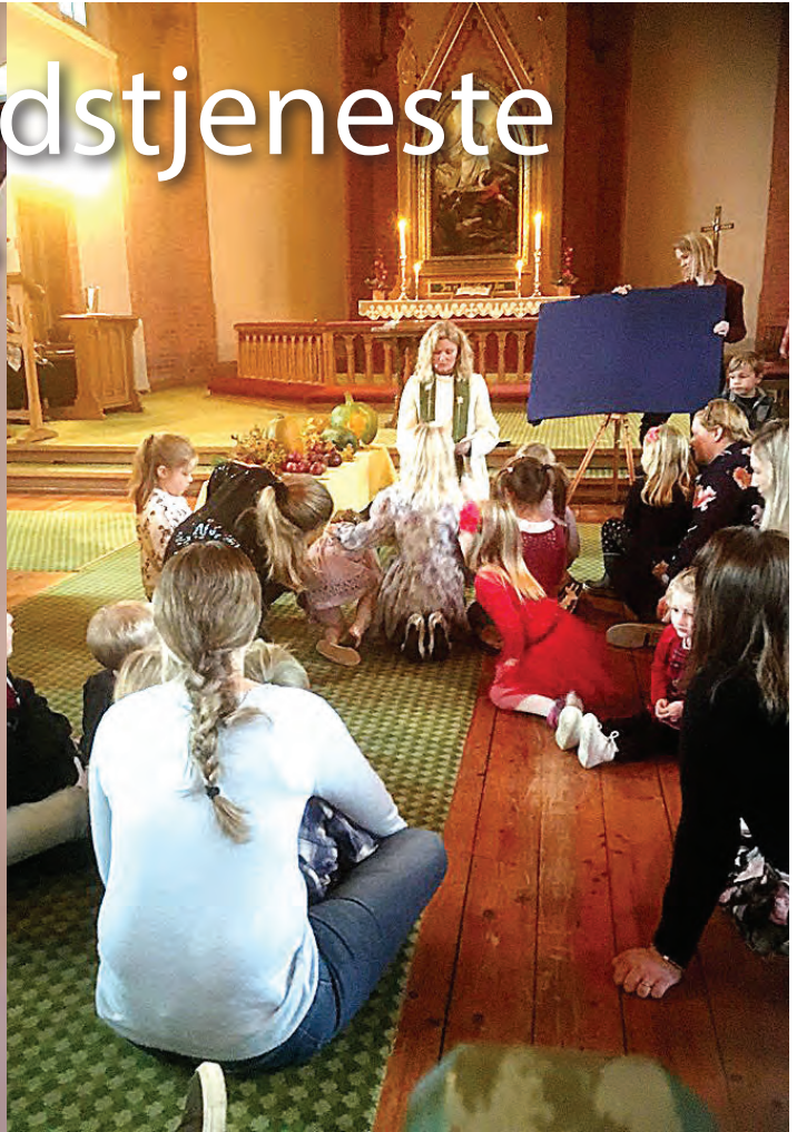
Stort engasjement fra store og små barn som ville hjelpe til å skape verden på flanellograf.