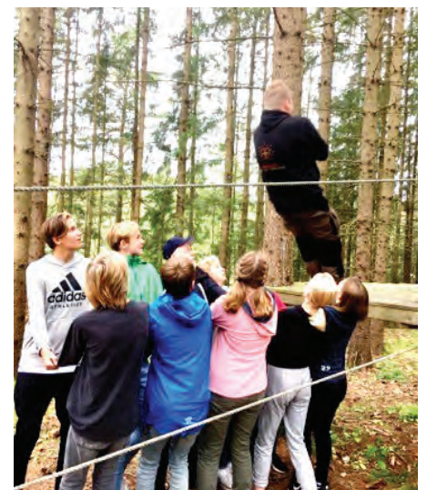
Teambuildingsløypa var utfordrende, spennende og handlet om samarbeid. På tillitsfallet tok gruppa imot en som falt bakover.