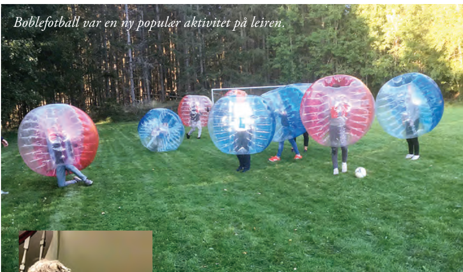
Boblefotball var en ny populær aktivitet på leiren.

Det ble en svært vellykket leir. Vi jobber for at konfirmanter i årene som kommer skal få oppleve en hel helg og ikke bare ett døgn hver.