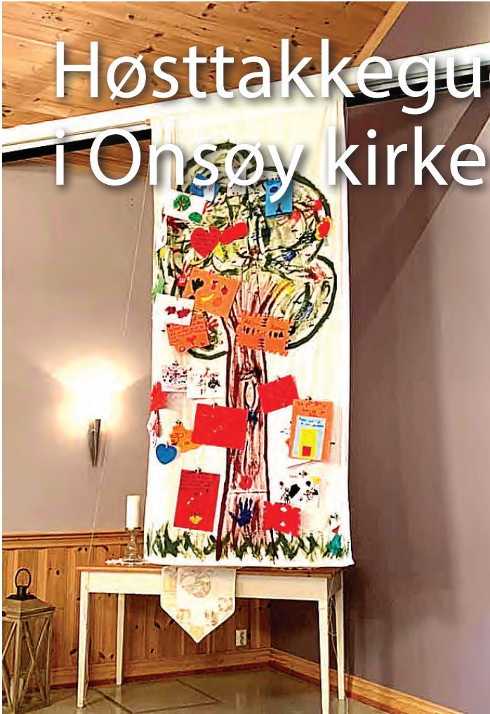
Fargerikt takketre med barnas takkebønner.