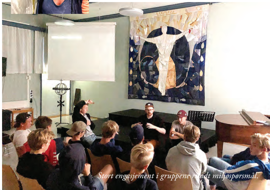
Stort engasjement i gruppene rundt miljøspørsmål.