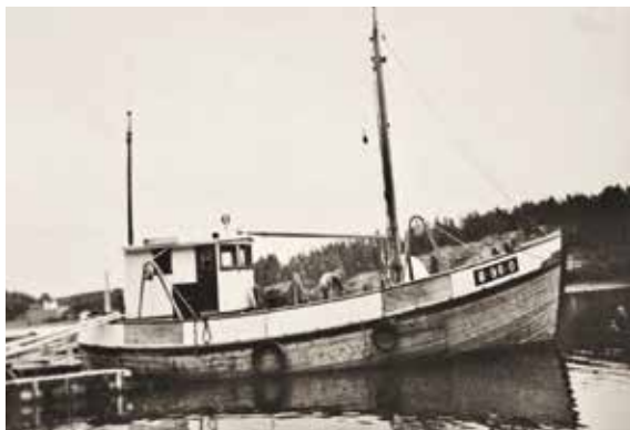
Havbris, en av mange fiskeskøyter bygget på Rød.