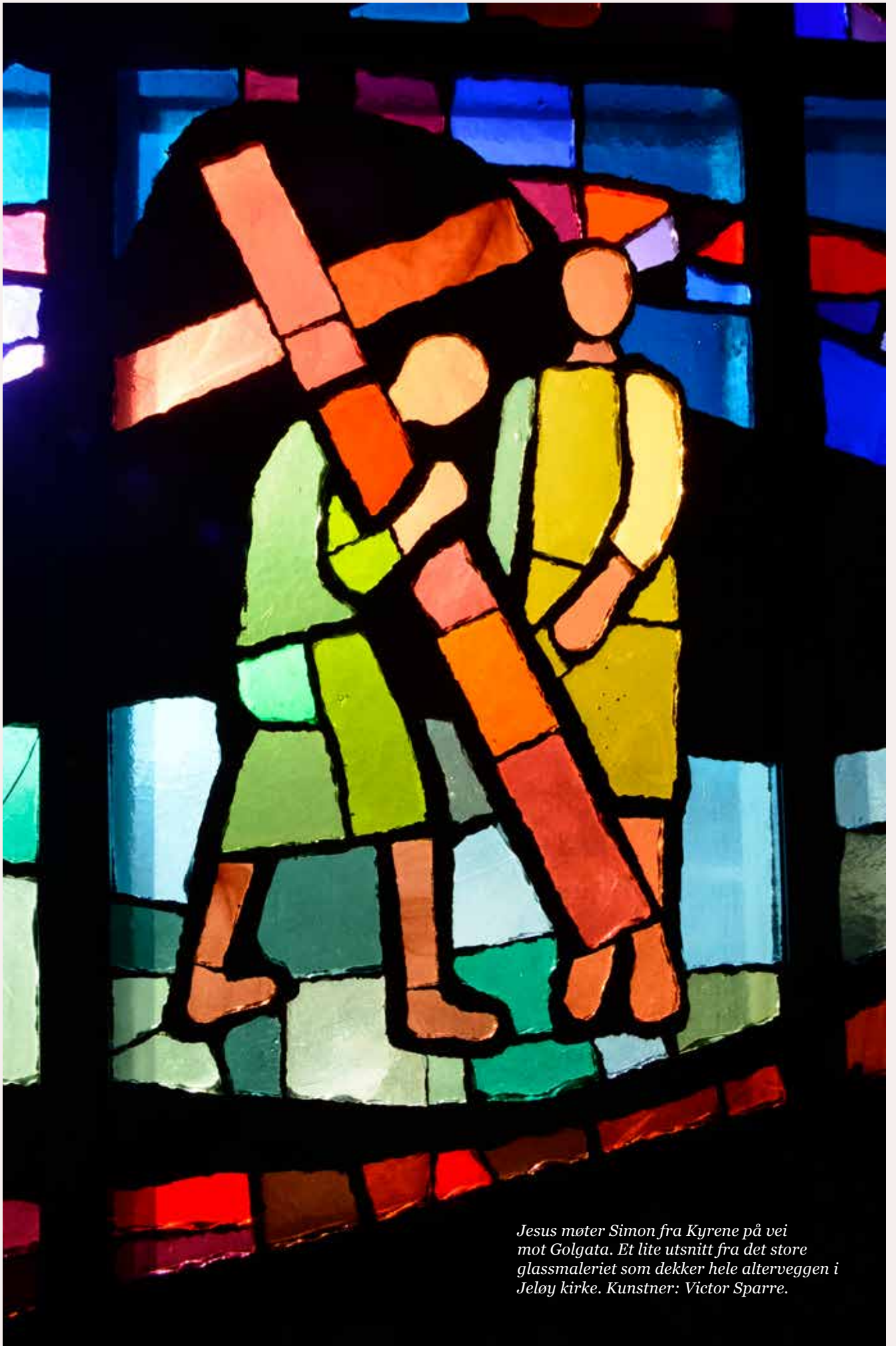
Jesus møter Simon fra Kyrene på vei mot Golgata. Et lite utsnitt fra det store glassmaleriet som dekker hele alterveggen i Jeløy kirke. Kunstner: Victor Sparre.