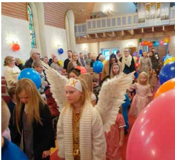
Karnevalsprosesjon i Gressvik kirke.

I februar feiret vi karneval på gudstjeneste for Små&Store i både Gressvik og Onsøy kirke. Det ble en fest med masse ballonger, utkleddede både små og store, sang, musikk og «dansemoves».