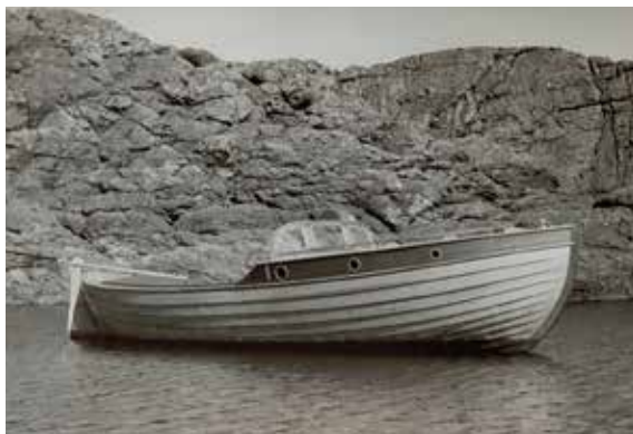
Snekke fra Gressvik Gresvik Baatbyggeri.