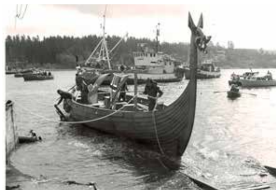
Odin Ravn sjøsettes.

med 16 til rors, samt rormann. I 1986 ble det også bygd et 50 fots vikingskip, "Havørn", som står på Bygdøy.