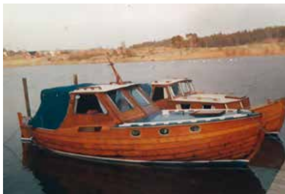
Gaustadsnekker med forskjellig overbygg.

Gaustadsnekka var et kjent begrep i Onsøy, og den ble bygd på slutten av 1800- og første del av 1900-tallet. Båtbyggeren Jens Andersen Gaustad ble født 5. november 1856 på Borge østre og døde 14. februar 1939, 83 år gammel,