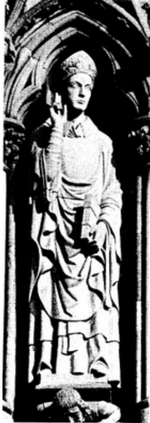
Bilde fra Vestveggen på Nidarosdomen.

En pavelig helligkåring av Thorlákr har aldri funnet sted, og det skulle ta nesten 800 år før den lokale saligkåringen fikk en offisiell pavelig annerkjennelse. Det skjedde da pave Johannes Paul II (1978-2005) den 14. januar 1984 stadfestet hans hellighet ved å utrope den hellige Thorlak til Islands skytshelgen.