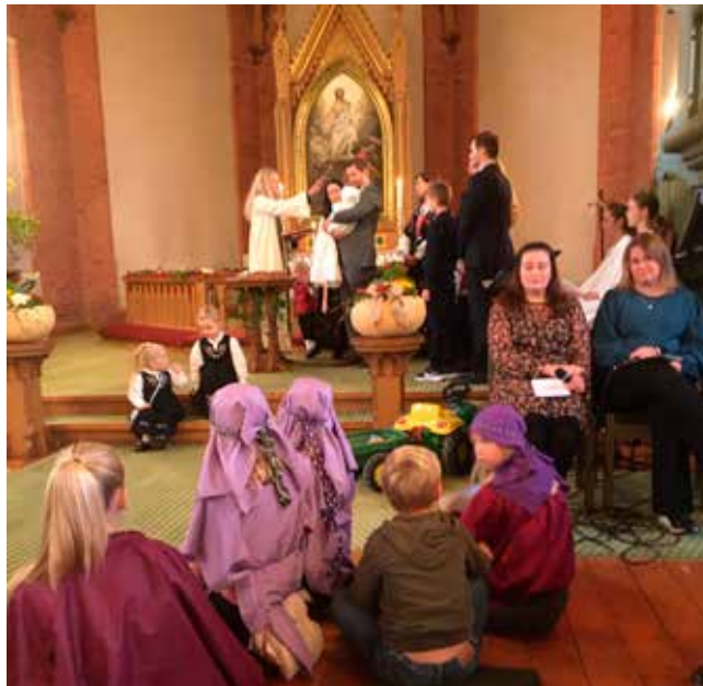
Det var yrende liv på Høsttakkegudstjenesten denne dagen. Mange bidro til å gjøre dette til en spesielt flott fellesskapsopplevelse for både små og store.