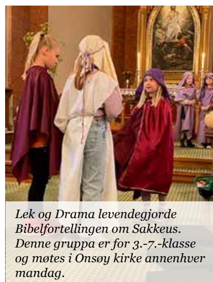
Lek og Drama levendegjorde Bibelfortellingen om Sakkeus. Denne gruppa er for 3.-7.-klasse og møtes i Onsøy kirke annenhver mandag.