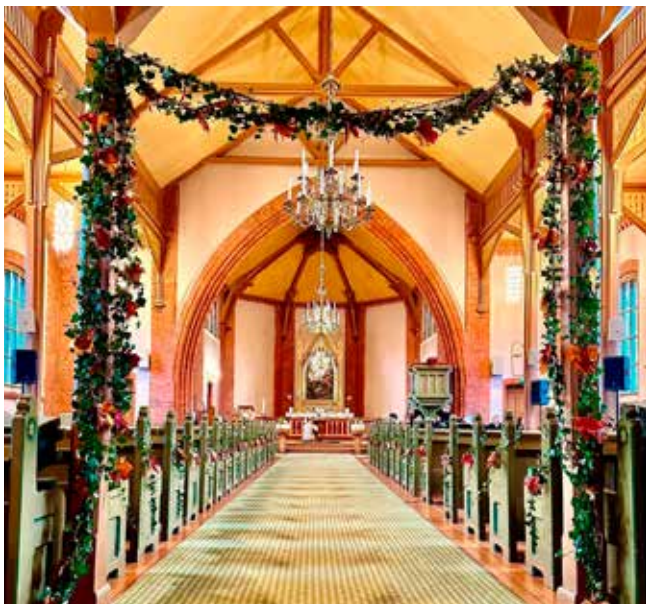
Alle ble ønsket varmt velkommen til Høsttakkegudstjeneste i Onsøy kirke 16. oktober. Kirken var fantastisk flott pyntet av Elisabeth Ørmen fra Tommelisehagen og medhjelper Eilen.