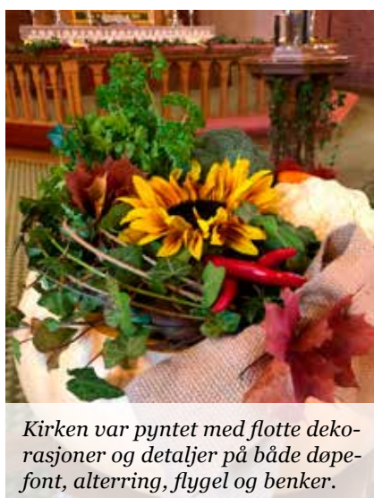
Kirken var pyntet med flotte dekorasjoner og detaljer på både døpefont, alterring, flygel og benker.