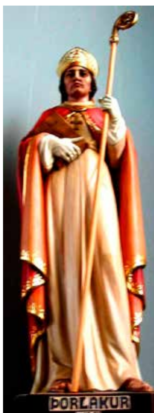
Skytshelgen for Island.

I vår serie om norske helgener skal vi denne gang presentere Den hellige Thorlak Thorhallsson. Han ble født på Island i 1133. Island var fra tidlig vikingtid og frem til midddelalderen regnet som en del av Norge, og derfor er også den islandske helgenen Thorlag historisk sett på som en norsk helgen.