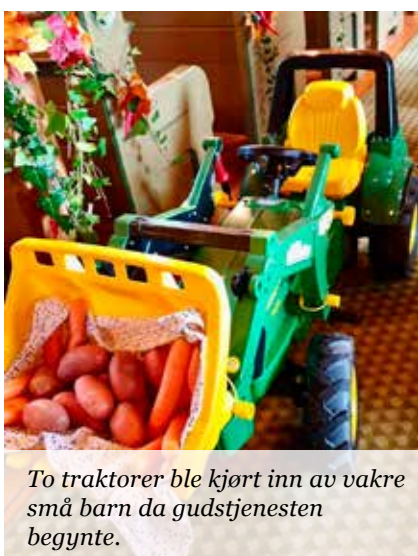
To traktorer ble kjørt inn av vakre små barn da gudstjenesten begynte.

En spesiell takk til Tommelisehagen som var sterkt med å gjorde dette til en uforglemmelig Høsttakkefeiring.