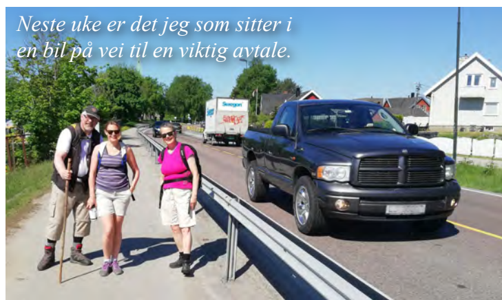
Neste uke er det jeg som sitter i en bil på vei til en viktig avtale.

Vi brukte fire dager fra Halden til Rygge. Etter hver dagsetappe ble vi hentet med minibuss og kjørt til Stenbekk leirsted, der vi spiste sen middag og overnattet til neste dag. Etter frokost ble vi kjørt tilbake til samme punkt for å fortsette neste etappe. Vi gikk altså på våre egne ben hver eneste meter, fra Halden jernbanestasjon til Rygge kirke.