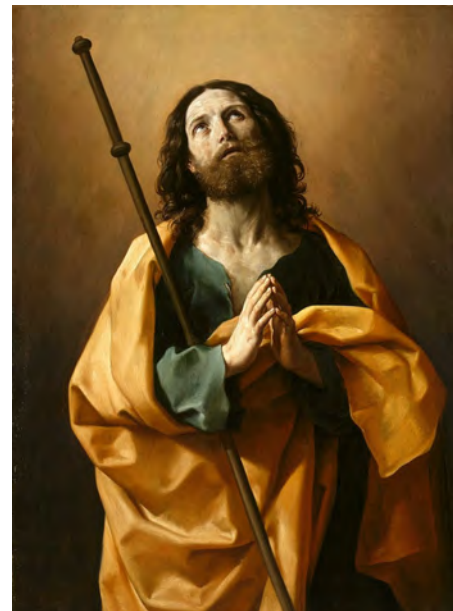
Apostelen Jakob, maleri av Guido Reni, 1636-1638

Det arrangeres mange turer hvor du tilbys å delta på kortere eller lengre deler av pilegrimsrutene som fører inn til Santiago og den storslåtte katedralen. En slik tur byr på muligheter for