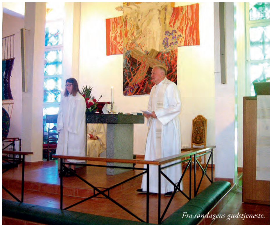
Fra søndagens gudstjeneste.

Noen av oss var med på aktiviteter i form av korsang, musikkgruppe, formingsgruppe, bibelvandring i sansehagen. Dette var aktiviteter som var forberedelser til søndagens gudstjeneste.