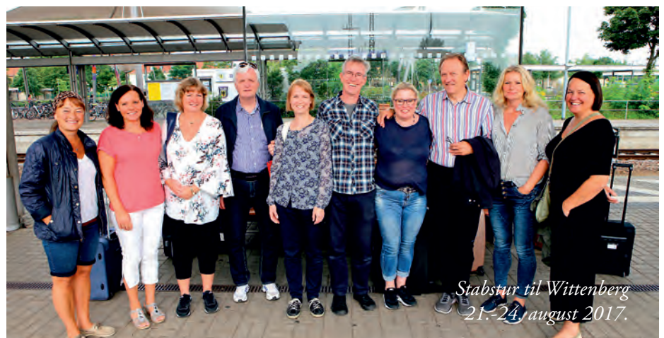
Stabstur til Wittenberg 21.-24. august 2017.