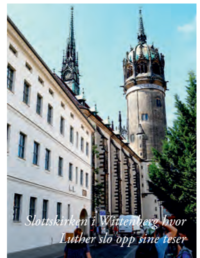
Slottskirken i Wittenberg hvor Luther slo opp sine teser