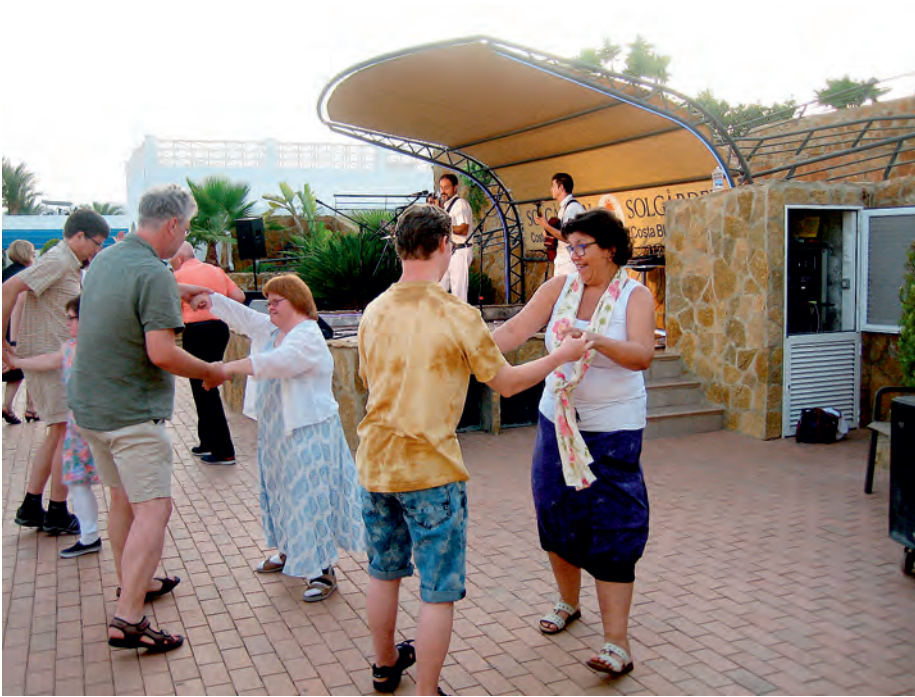
Hver kveld var det dans.

Vi har vært og vasset/badet i Middelhavet! Og vi har badet i bassengene.