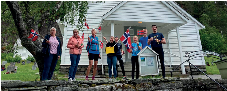
Varm mottaking med flagg og heiarop i Hålandsdalen!