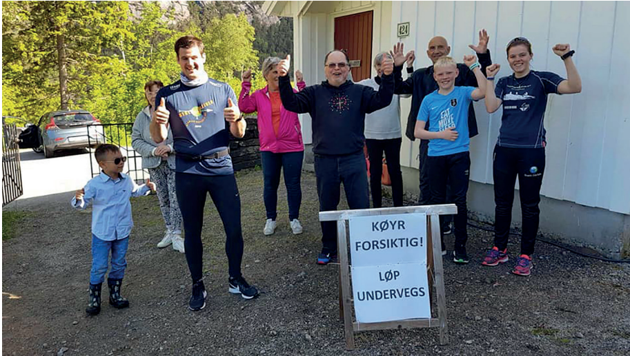
Her er supportargjengen i Sævareid!