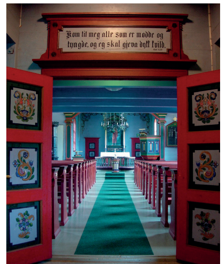
Midt i kyrkjeskipet heng den spesielle og vakre lysekruna.

met. Tidlegare hadde det vore lys berre på alteret.