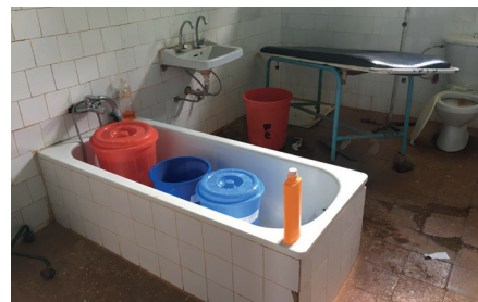
Dette er rommet som skal bli til nytt sårbehandlingsrom.