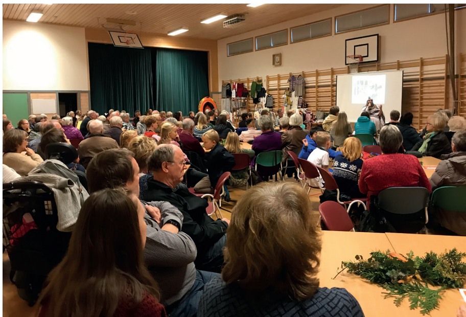
Stor oppslutning om Bruktbuo sin basar søndag 4. november 2018.