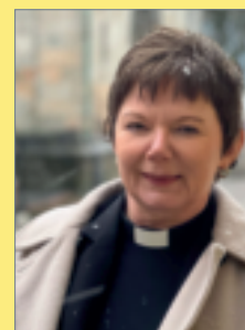
Biskop Ragnhild Jepsen

(Svein Ellingsen, Norsk salmebok nr 209)