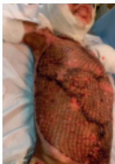
Sumeya har her utført transplantasjon i mage- og brystregion.