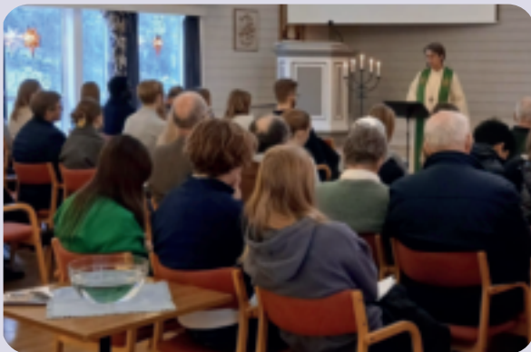
Familiemix 11. januar