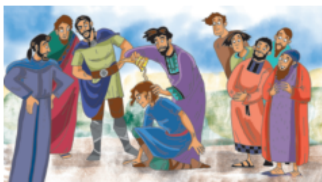
Teikning: Kari Sortland

Samuel hørde mange ting frå Gud. Då Samuel blei vaksen fortalde Gud han kven som skulle bli konge. Kan du finne fem feil på bildet under?