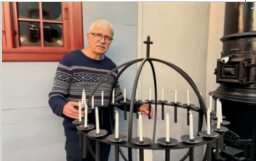
Jesuslyset i lysgloben skal brenna. Kyrkjetenaren legg til rette for dei som vil tenna sitt vesle lys for trøyst, bøn og takk.

Kyrkjetenaren syter for opne rømningsvegar kvar gong det er arrangement i kyrkja. Og ein gong i året går han gjennom branninstruks med alle som gjr teneste der. Og når kuldegradene kryp inn i vegger