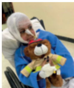
Bjørnis vart ein god venn og trygg å halde i.