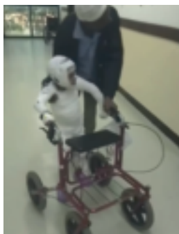
Svært store delar av kroppen er brannskadd. Her ser vi at stort sett heile kroppen er bandasjert, og øver på å gå att.