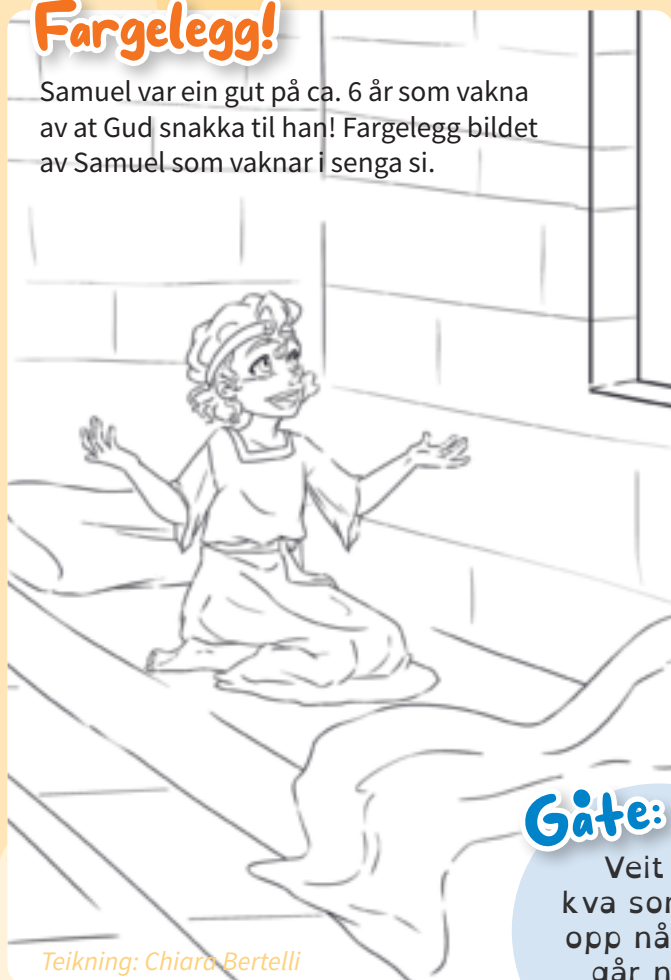
Teikning: Chiara Bertelli

Samuel var ein gut på ca. 6 år som vakna av at Gud snakka til han! Fargelegg bildet av Samuel som vaknar i senga si.