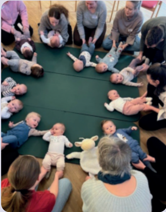
Eit knippe av dei mange påmeldte på Babysang denne våren