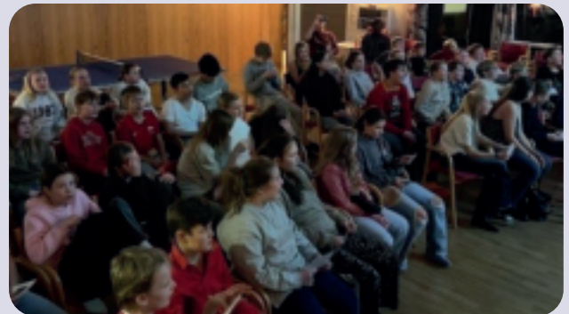
Ein strålende flott gjeng på Tweens-spesial 12. desember!