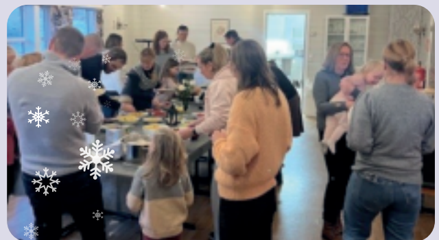
God stemning på Minglemiddag med Taco på menyen