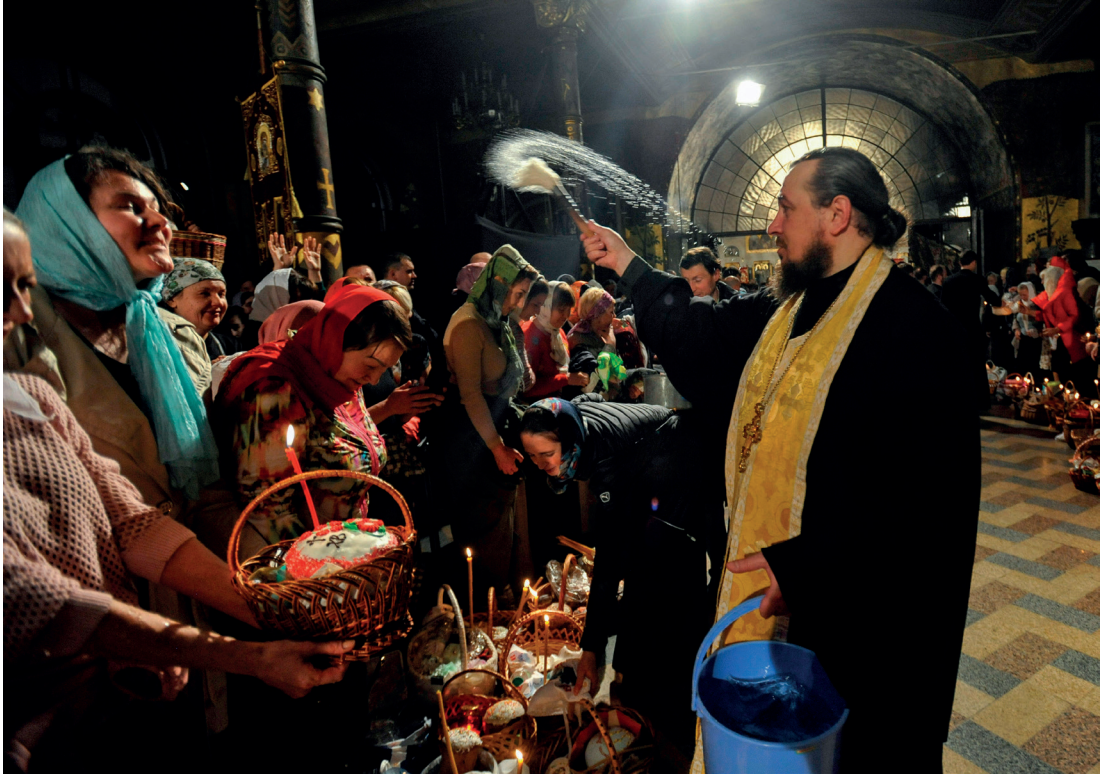
Ukrainsk prest velsigner kaker og påskeegg

lokalsamfunnet. Til og med fremmede på gata og på bussen hilser hverandre med “Kristus er oppstått!”, og svarer hverandre med “Ja, han er sannelig oppstått!”