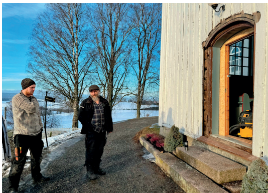
Døra er tatt ut, og det er satt inn midlertidig byggedør

Etter at vinduet var malt opp igjen, ble det satt tilbake, og i slutten av januar ble det montert varevindu på innsiden. Varevinduet bevarer det gamle vinduet, og holder samtidig på varmen. I skrivende stund er døra i sørskipet tatt ut, og får samme behandling som vinduet har fått, og der er det også råteskader i karmen og listverket.