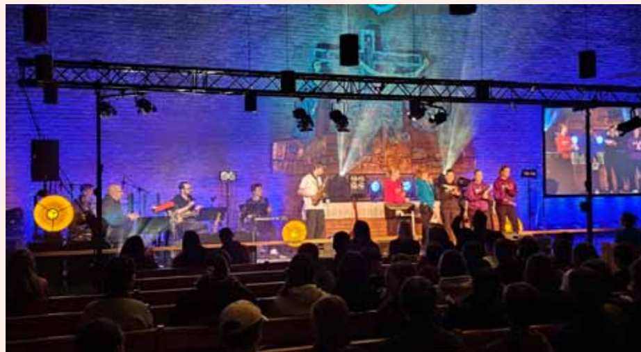
Det spares ikke på noe når ungdomslederne inviterer alle konfirmanter i Gjøvik kirkekommune til Kickoff i Hunn kirke.