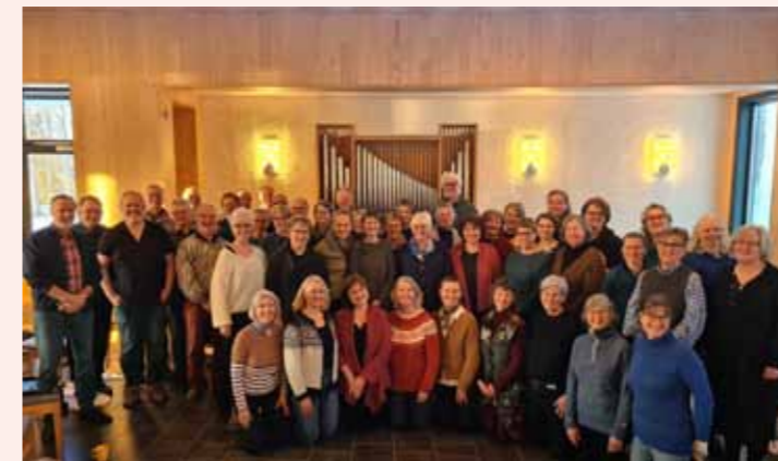
Schola Sancti Petri består av 55 sangere.

Johannespasjonen er et følelsesmessig sterkt verk, og får oss til å reflektere over Jesu lidelse. Vi blir utfordret til å reflektere over lidelsen som skjer rundt oss også i vår moderne verden. Musikken er en gripende og sterk opplevelse for både medvirkende og publikum. Billetter: 250 kr ved inngang, eller på tikkio.com