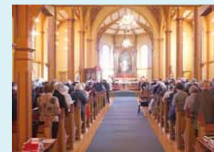
Gjøvik menighet håper på full kirke på NRK-gudstjenestene

– Vi vil selvsagt være topp forberedt og alt må times på minuttet, men det viktigste er at vi får masse folk på gudstjenestene med god salmesang og deltakelse fra menighetene i Gjøvik. Gudstjenestene går direkte fra kl 11.03 (etter Dagsnytt), og du kan også se gudstje-