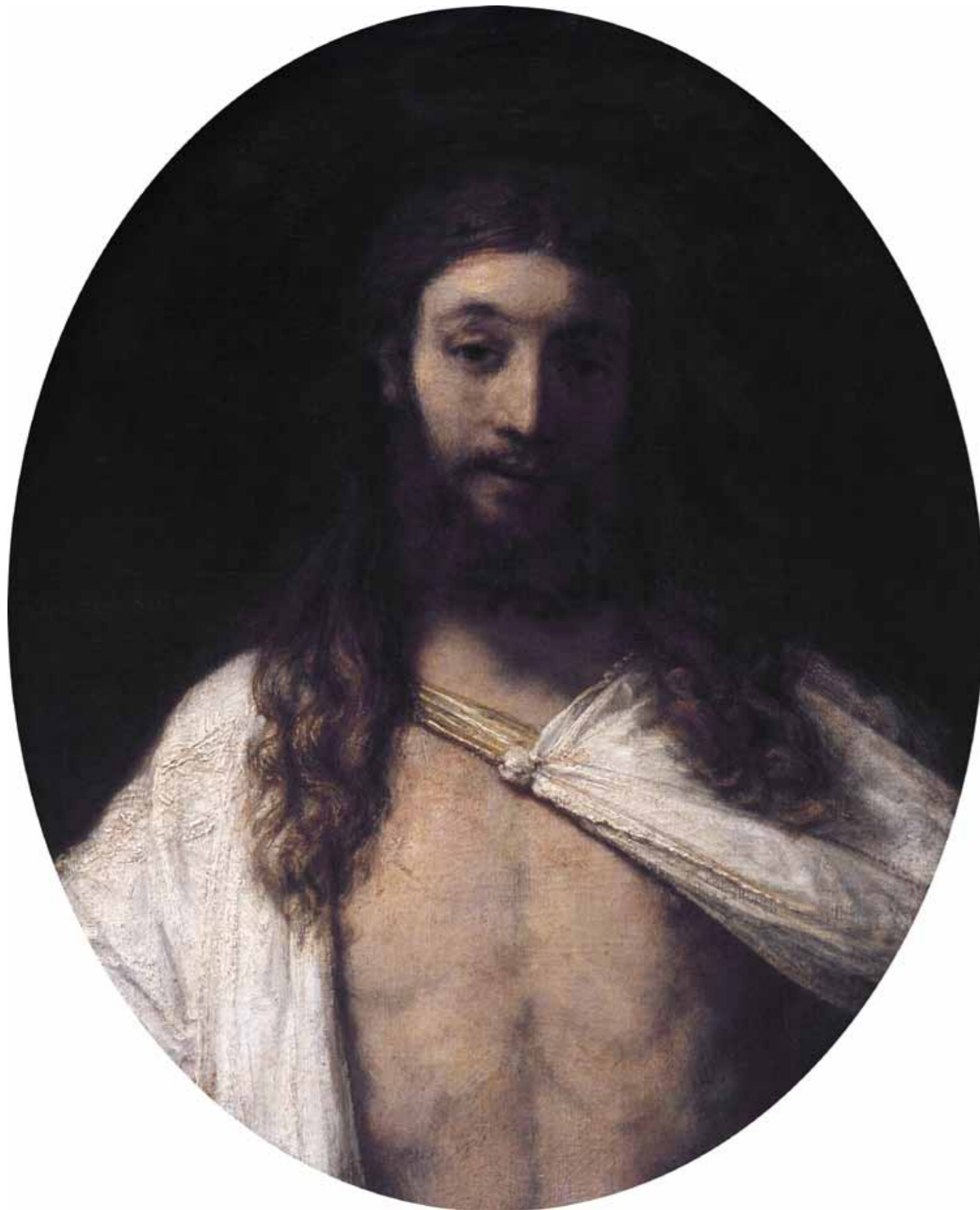
Den oppstandne Kristus. Rembrandt 1661