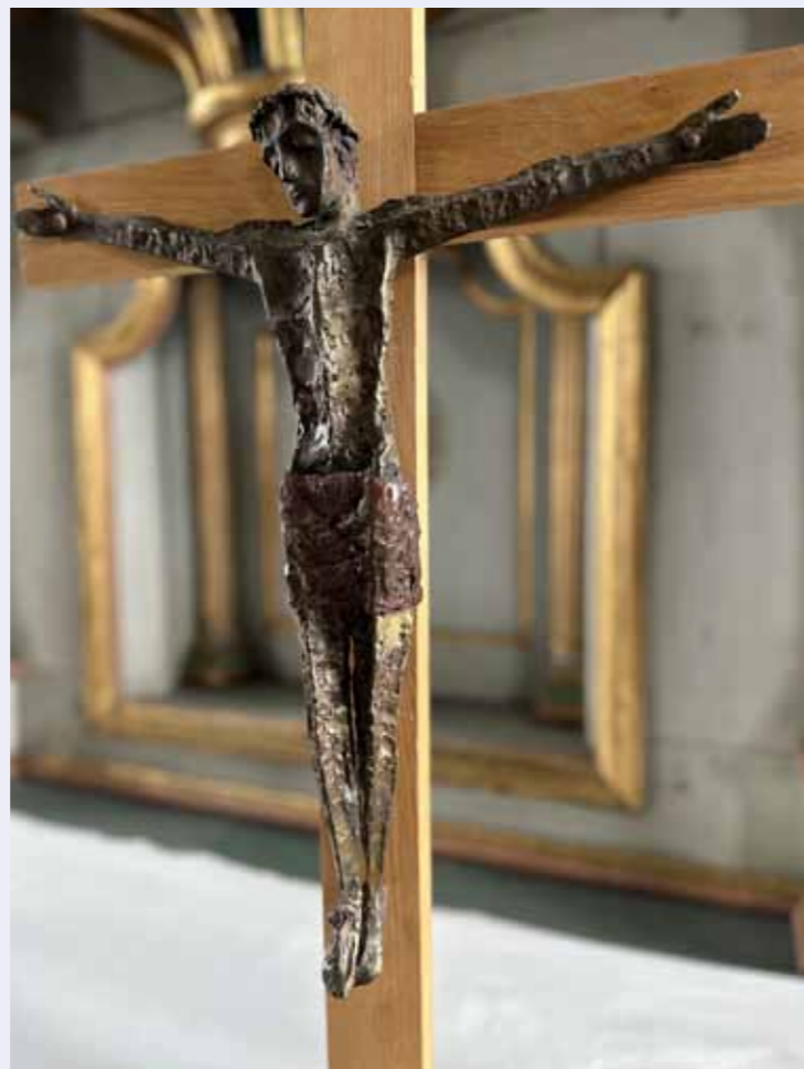
Krusifiks i Vardal kirke

Og Jesus blir slått til blods og hånet. Og til sist blir han hennrettet, hengt på et kors. Jeg synes alltid det er tøft å sette seg inn i andres lidelse, å se bilder fra krig og katastrofer. Men med påsken er det også noe mer. At det som skjer, det skjer for min skyld. At Jesus lider og dør, fordi mitt liv ikke er bra nok? Men det handler ikke bare om meg. Påsken er Guds oppgjør med all ondskap og død. Klart det må bli voldsomt. Og heldigvis, etter å ha gått gjennom alt dette kommer vi ut i et nytt rom, i oppstandelsens rom. Og heldigvis så er det i dette