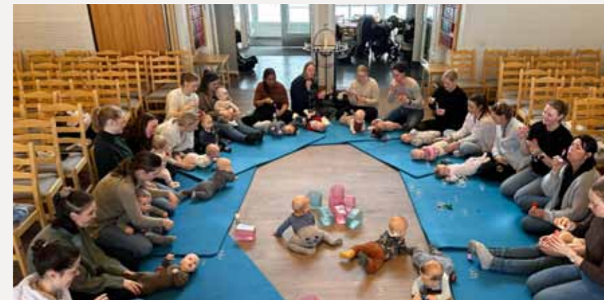
Babysang i Engehaugen kirke er populært.