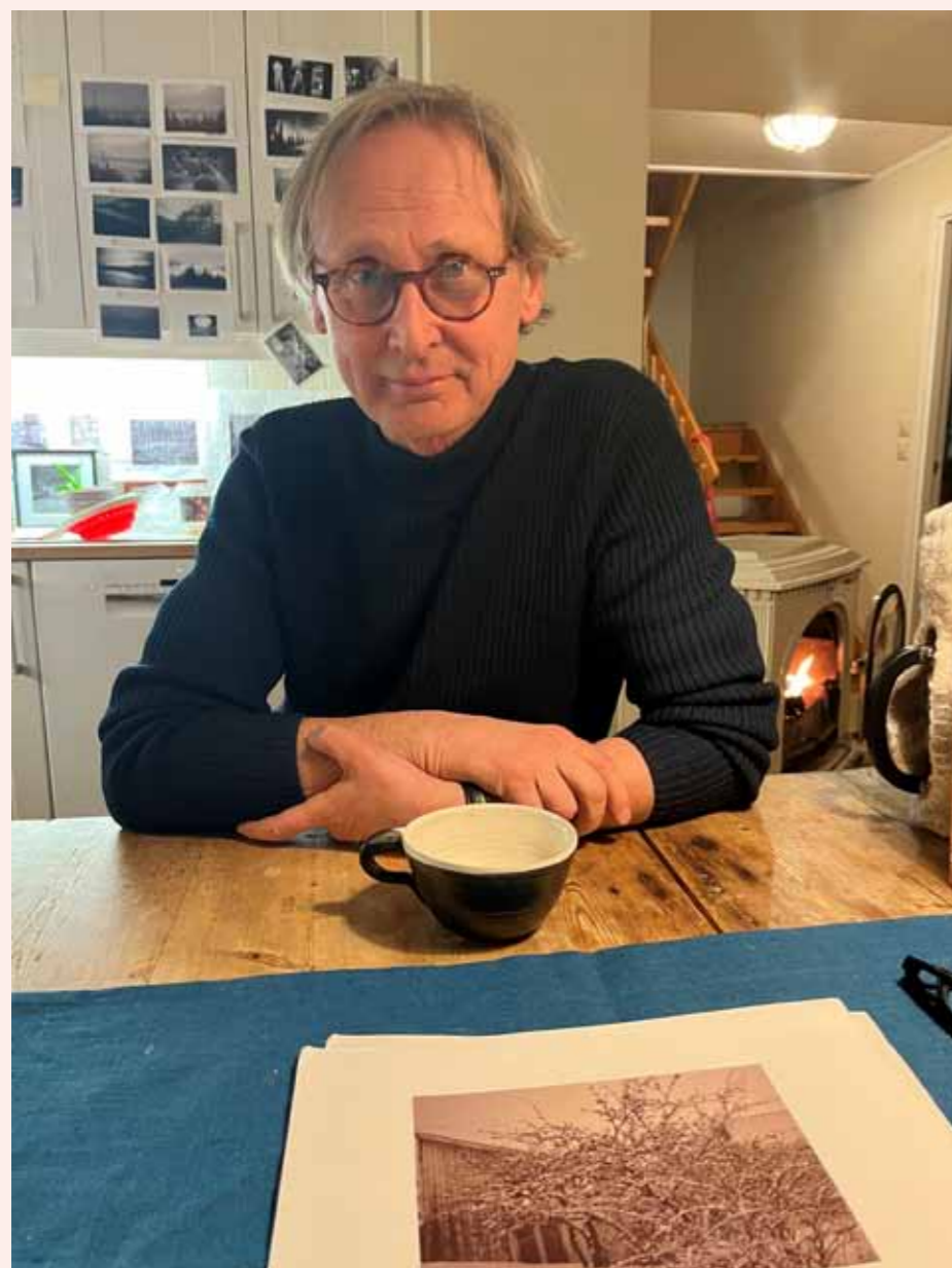
Slik bor en filosof og fotograf.

Du har nok helt sikkert møtt han før, høyreist, slentrende, langhåret og blid, gjerne med ei skulderveske på tvers og et fotoapparat i hånda. Aller helst gående.