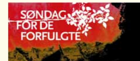
Menigheter verden over markerer andre søndag i november som «Søndag for de forfulgte».

Vi hører ikke så mye om dette i Norge. Det er andre saker og kamper som preger vårt nyhetsbilde. Mange som kommer til tro i disse landene tar opp sitt kors og følger Jesus selv om de kanskje mister arbeid, hjem og familie. Mange beskriver allikevel en nyvunnet frihet og ro, selv om de ytre livsbetingelsene har blitt dårligere