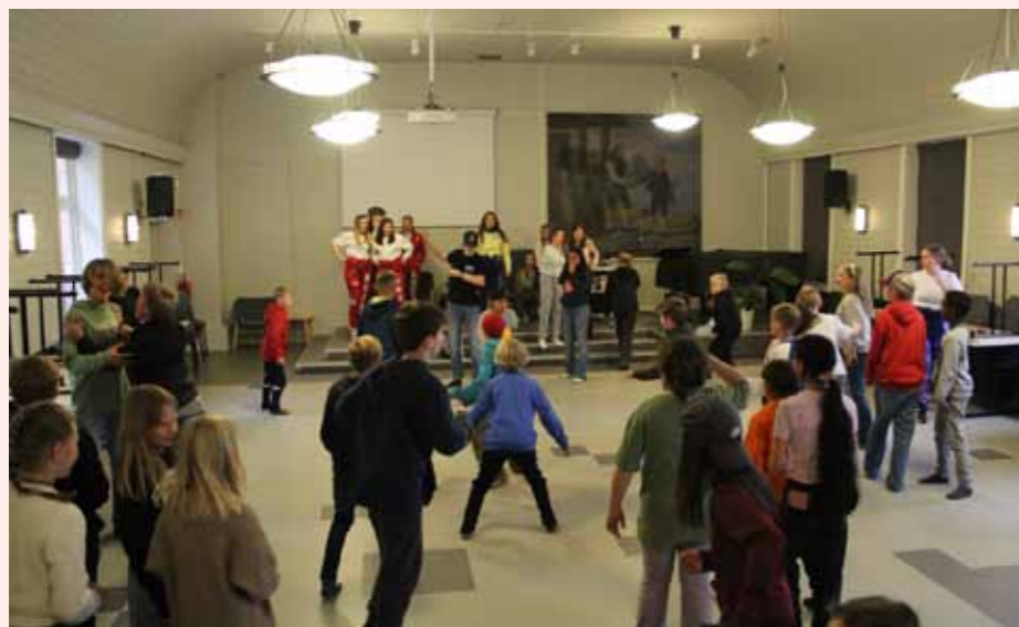
Party på Ynglingen har etablert seg som et populært tiltak for aldersgrupper fjerde til sjuende klasse.