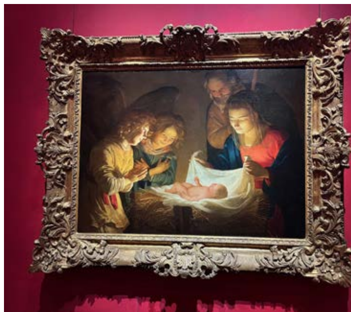
Adoration of the Child av Gerrit van Honthorst avfotografert fra Uffizigalleriet i Firenze.