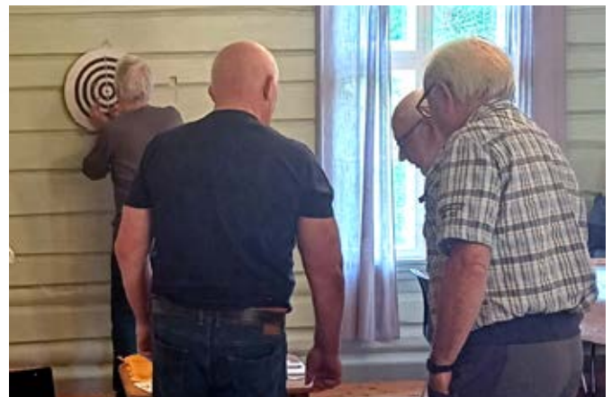
Ivrige dartspillere på Øverbygda bedehus.