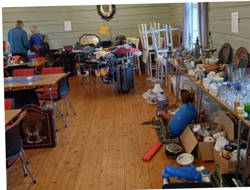
Loppemarkedet og basaren som ble arrangert i vår ble en stor suksess!