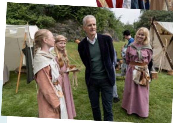
Statsministeren på kirkejubiläumet.