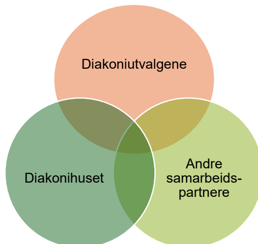
Fig 1. Diakoni skjer ut fra lokale diakoniplaner, Diakonihusets fellestilltak og diakonalt arbeid med ulike relevante samarbeidspartnere. Eksempel besøkstjeneste: Lokalplan prioriterer besøkstjeneste. Diakonihuset kan bistå med en lokalt forankret besøkstjeneste.