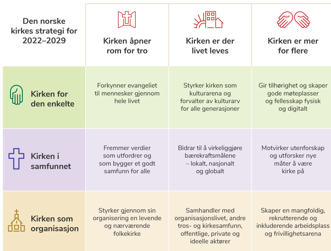
Den norske kirkes strategi for 2022-2029

Den norske kirke er en bekjennende, åpen, tjenende og misjonerende folkekirke, som vitner i ord og gjerning om frelse, frihet og håp i Jesus Kristus.