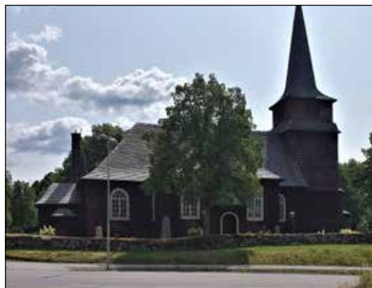
Östmark kirke i Sverige