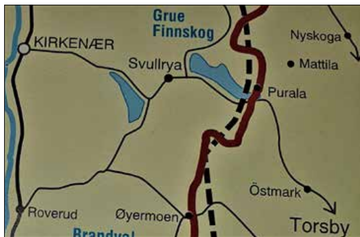
Kart over deler av Finnskogen