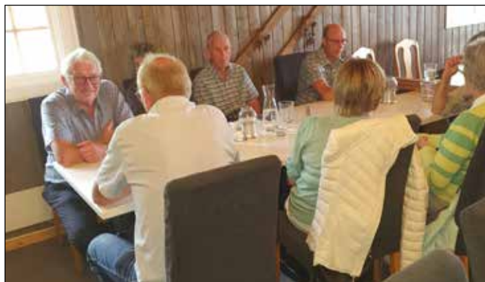
Fra middagen på Finnskogen turist- og villmarkssenter