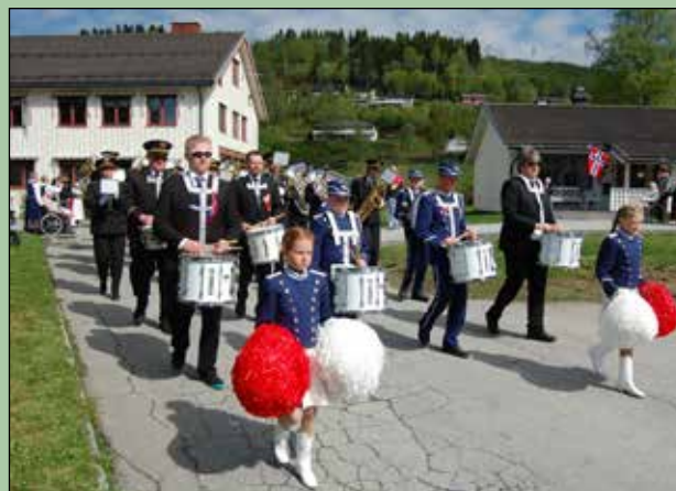
Fra 17. mai 2018