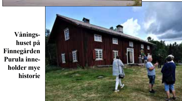
Våningshuset på Finnegården Purula inneholder mye historie