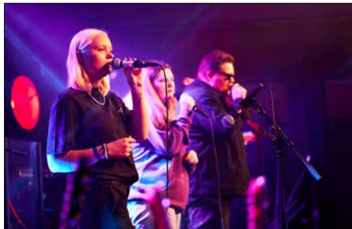
Ungdomsledere som var forsangere, band og programledere på leiren! Uten ungdomsledere hadde vi ikke fått til leir!