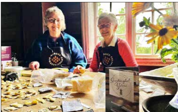
Snertingdal bygdekvinnelag deltok med småbrødbaking og smaksprøver av ost fra Snertingdal m.m.