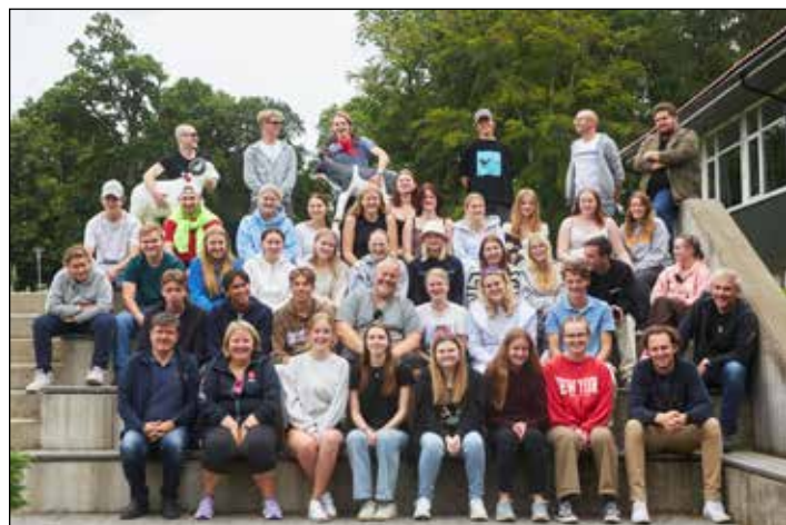
Bilde av lederne som laget leir til konfirmantene! Her deltok også noen fra Snertingdal.