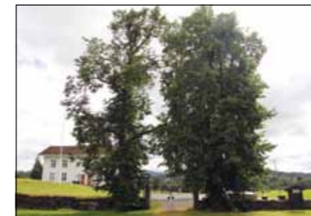
Parklindtrærne ved Tingelstad kirkegård i blomst og hugget ned. Tekst og foto: Inger S. Haug.

av at humlene ikke tåler nektaren og pollen fra den blomstrende parklinden, men det er nok flere årsaker. Det kan skyldes en duft som lokker humlene til å tro at det er igjen nektar, noe det ikke er også dør de av sult og utmattelse. Eller de går i «lindfella», som betyr at humlene oppsøker de fristende lindetrærne og der venter kjøttmeisene på sitt næringsrike bytte. Også er det så enkelt at humlene dør en naturlig død pga. alderdom. (Kilde: Humleskolen, «Lindfella» 2018).