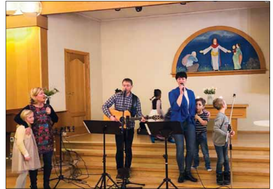
Annenhver søndags ettermiddag inviteres det til Søndags Liv på Jaren Misjonshus. Sang sammen med barna er en viktig del av samværet. Når prekenen blir holdt, er det søndagsskole for barna i peisestua.