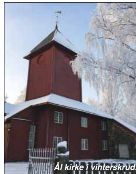
Ål kirke i vinterskrud.