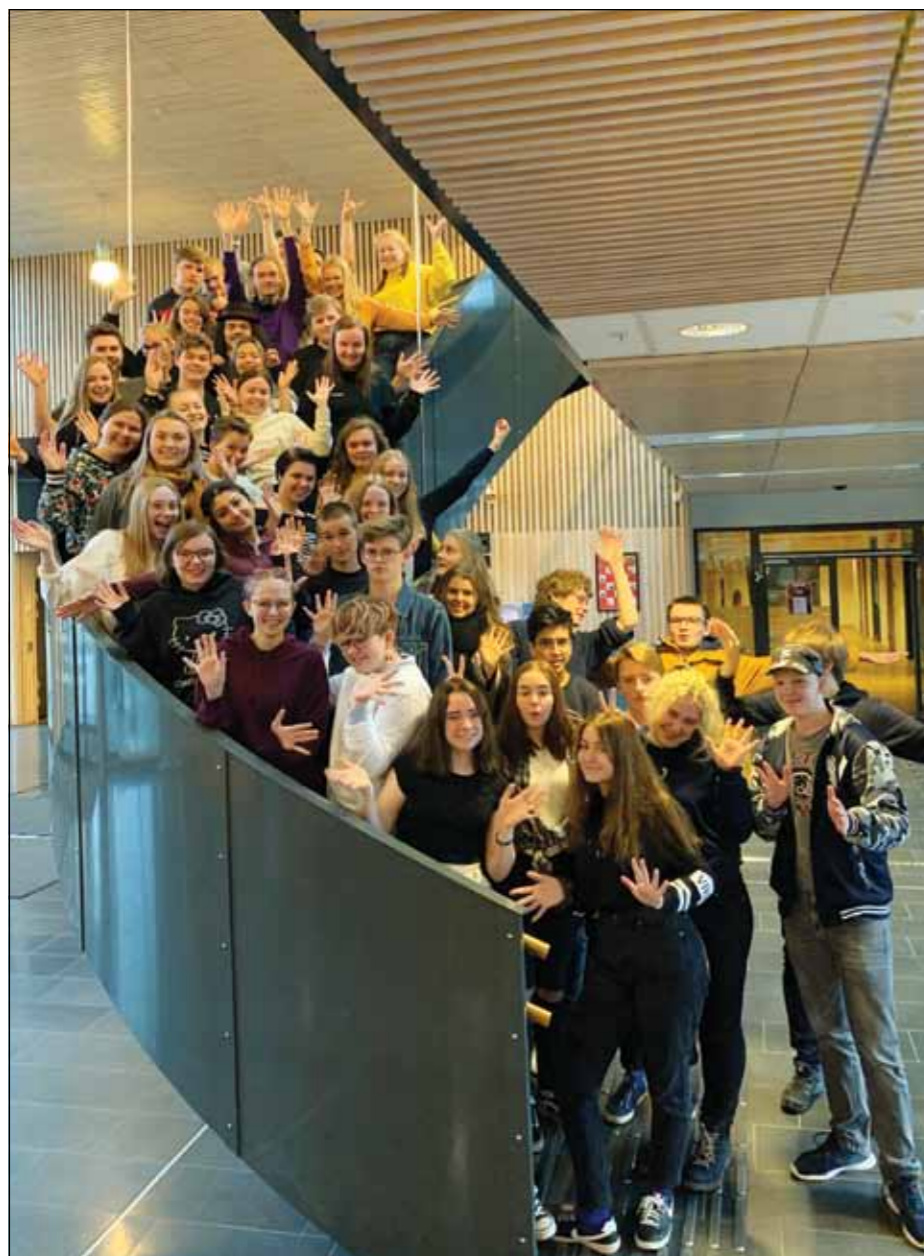
Musikk- og dramaelevene gleder seg til konsert 29. november.

Fredag 29. nov. kl. 19.00: Konsert i Tingelstad kirke med musikk- og dramaelever på Hadeland videregående skole.