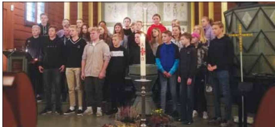
Fra presentasjonen av neste års konfirmanter i Ål kirke 20. oktober.