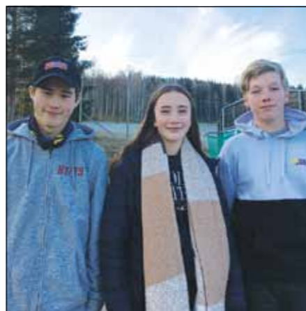
Tre av de fire konfirmantene i Bjonerua 2020.