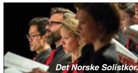
Det Norske Solistkor.

Torsdag 5. des. kl. 19.00: Konsert i Mariakirken med Det Norske Solistkor (solistkoret.ticketco).