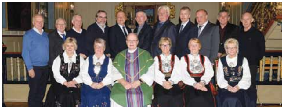
50-årskonfirmanter i Nes kirke.