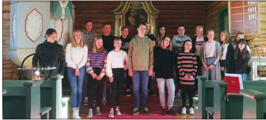
Fra presentasjonen av konfirmanter i 2020 i Moen kirke 22. september.