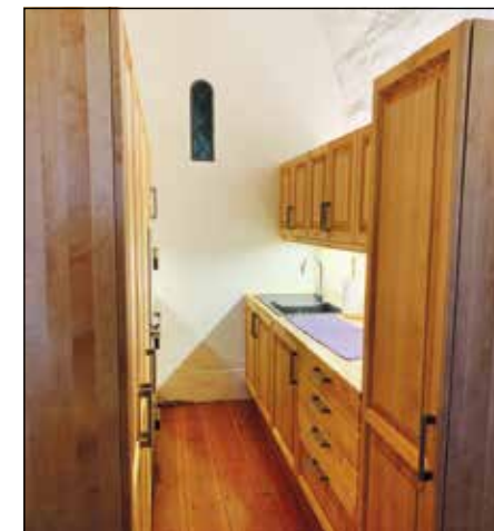
Nytt kjøkken i sakristiet i Nikolaikirken.

Orgelet i Tingelstad kirke har lenge hatt et behov for å bli restaurert. Fel-