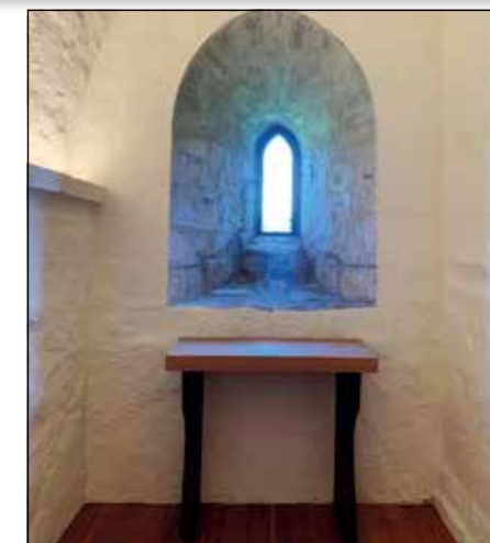
Sakristiet i Nikolaikirken.

Det er en god del slitasje og skader på alterskapet fra slutten av 1500-tallet i Nikolaikirken, og det er vedtatt at dette skal restaureres. Det ble i mai mnd. utført en del undersøkelser og testing av metoder som forberedelse til selve restaureringsarbeidet. Fel-