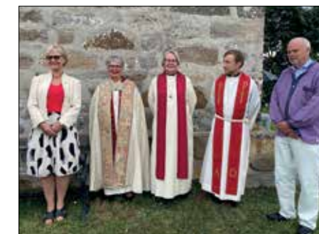
Fra festgudstjenesten 28. juni.