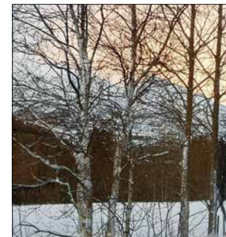
Utsikt fra kirkekontoret i Hemsedal.

Å løfte blikket fra oss selv kan noen ganger være helt nødvendig for å få nytt perspektiv på livet.