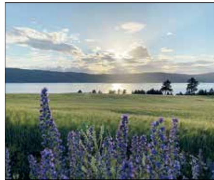
Glimt utover Randsfjorden.