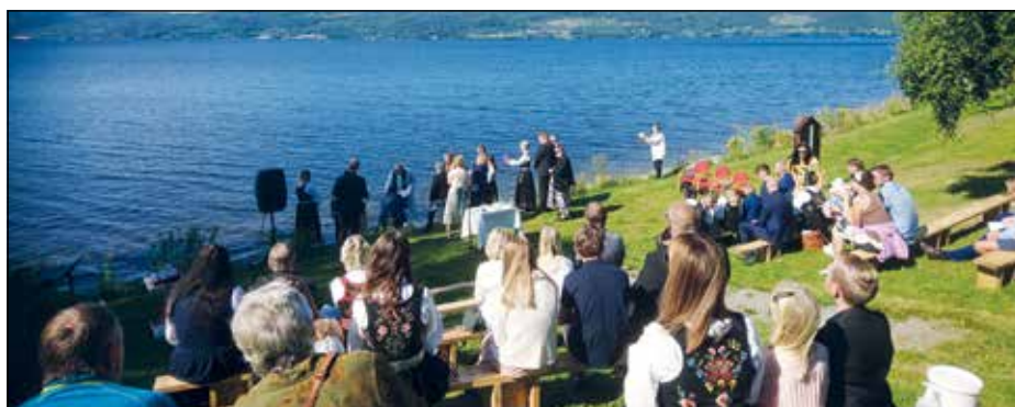
En festkledd menighet deltok i selve dåpshandlingen i Randsfjorden.

Randsfjorden lå som en blå perle i skinnende sol da det ble gjennomført to dåpsgudstjenester ved Kirketangen ved Nes kirke. Det er ikke tillatt med store forsamlinger nå når koronapandemien herjer. Derfor ble to barn døpt i hver gudstjeneste. Det var satt opp benker med god avstand, antibacene var tilgjengelig slik at et godt smitteregime kunne gjennomføres. Et alterbord med hvit duk og lys var et blikkfang da vi kom ned til fjorden.