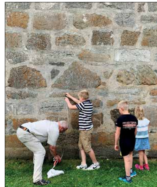
Et av spørsmålene fra elevene på Sanne var hvor høy Mariakirken er. Det ble et lite sommerprosjekt å finne ut av og nå har klassen fått vite at kirka er 20,5 m høy.

Ingen tvil om at læring skjer aller best der hvor man selv blir delaktig i undervisningen!