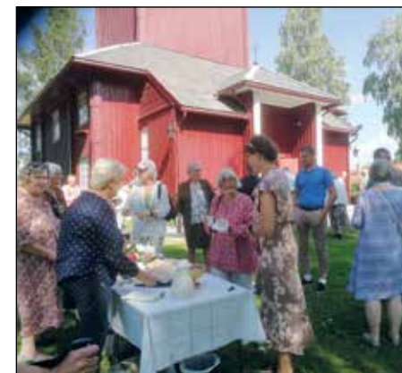
Fra kirkekaffen i sola utenfor Ål kirke 16. august.