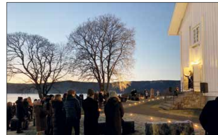
Ved Nes kirke møtte 128 opp til gudstjeneste kl. 16.00.