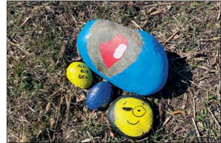
Steinene er malt av Sigridd Tvindesæter Øverli.

Jeg tenker at «håp» er et ord som forsøker å holde sammen det vi erfarer