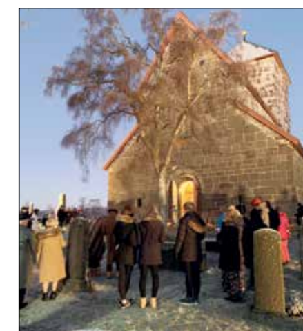
Klokka 16.00 var det klart for gudstjeneste foran Nikolaikirken. Her møtte 130 deltakere opp.