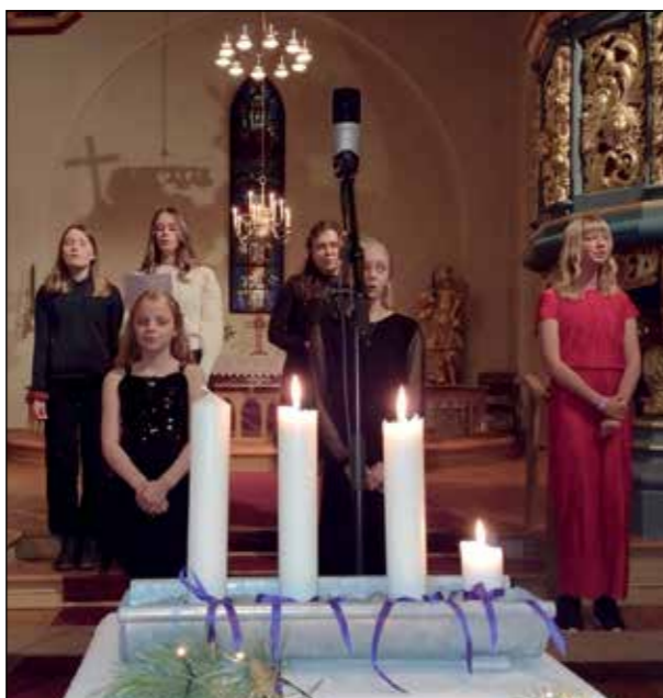
Brandbu Ungdomskantori.