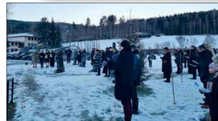
Foran Sørums kirke samlet det seg 65 deltakere i kaldt solskinn kl. 13.30.