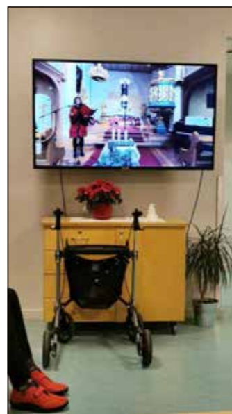
Filmen vises på Marka.