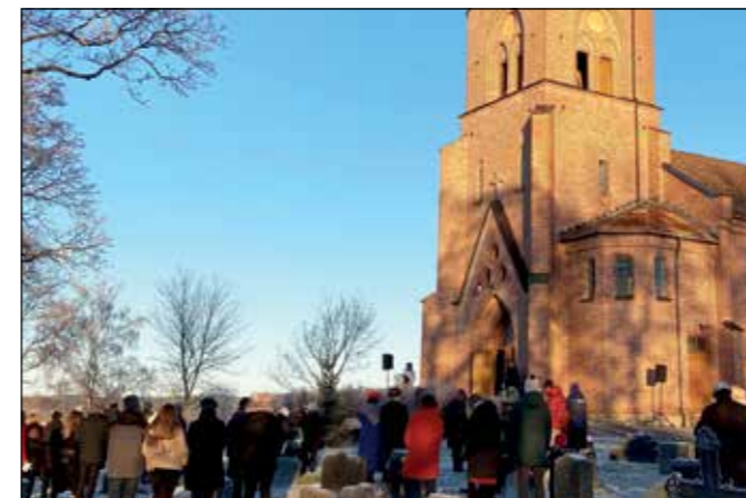
Foran Tingelstad kirke møtte 105 deltakere opp kl. 14.00 i flott solskinn og noen kuldegrader.