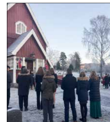
Foran Moen kirke kl. 14.30 samlet det seg 95 deltakere.