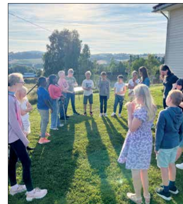
Kirken i Gran og Jaren Misjonshus startet opp Gran Soul Children i vår. På første samling etter sommerferien møtte det opp hele 16 barn og ungdommer til korøvelse. Noen av guttene var litt usikre på om de ville være med i kor, og da er det fint med flere ulike aktiviteter som biljard, snekring og matlaging!

Mer info: Kontakt Marit Wesenberg, tlf. 995 87 373.