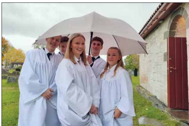
Konfirmanter i Nikolai kirken, oktober 2021.

Grymyr kirke 7. mai Tingelstad kirke 21. mai