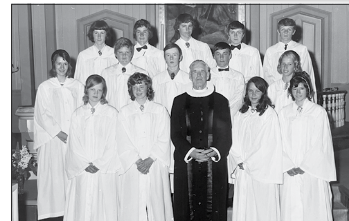
Konfirmantene i Grymyr kapell i mai 1972 representerer alle gullkonfirmantene som skal ha jubileumsfeiring i høst.

50-årskonfirmantene fra Grymyr og Nikolaikirken er invitert til gudstjeneste