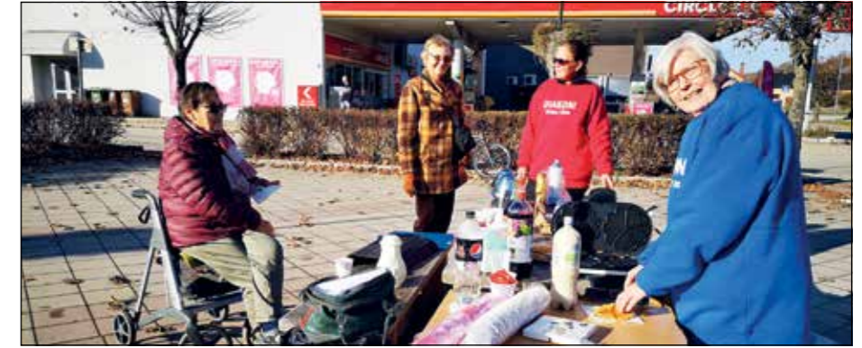
Diakoni er å være til for hverandre.

Lista over frivillige tjenester i kjerka er lang. Men jeg tror det er plass til enda flere, også i kjerka, med andre interesser enn det jeg har nevnt ovenfor. Det å bli pensjonist eller at en av andre grunner ikke kan stå i full jobb, betyr ikke nødvendigvis at en ikke har noe å bidra med i kirke og samfunn! Heldigvis har vi også Frivilligsentralen som er en aktiv aktør i kommunen vår når det gjelder å kanalisere frivillig tjeneste på mange vis, og vi har mange frivillige lag og foreninger, så mulighetene både til fellesskap og frivillig tjeneste er flere.