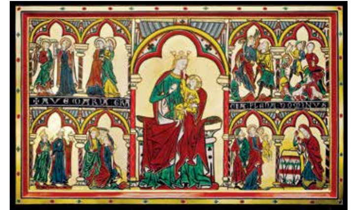
Rekonstruksjon av alterfrontalet i gamle Tingelstad, St Petri

Dette vidunderlige er egentlig med oss hele kirkeåret. Vi har fått adventstiden til å forsøke å ta det innover oss, og julen til å glede oss. For hvert lys som tennes i adventskran-