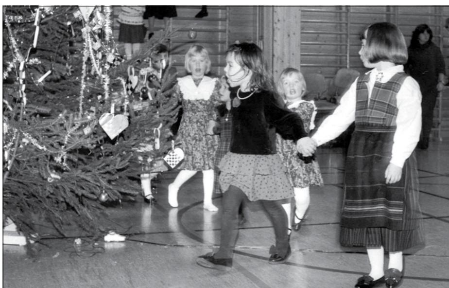
Småjenter på julefest i 1993 på Grymyr skole. (Foto: Avisa Hadeland).

Advent og jul bærer i seg en mengde tradisjon, noe er nedarvet gjennom århundrer, mens andre har endret seg og nye kommer til. Det kan synes som sang og musikk er minner som sitter aller best fast. Den dagen hukommelsen svikter og mye i personen er tapt, kan en sang eller musikkstykket være det som hentes opp av lageret med minner. Derfor kan det være spennende å dvele litt ved julesangene og tradisjonen rundt disse.