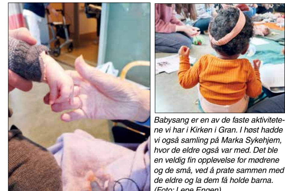
Babysang er en av de faste aktivitetene vi har i Kirken i Gran. I høst hadde vi også samling på Marka Sykehjem, hvor de eldre også var med. Det ble en veldig fin opplevelse for mødrene og de små, ved å prate sammen med de eldre og la dem få holde barna.