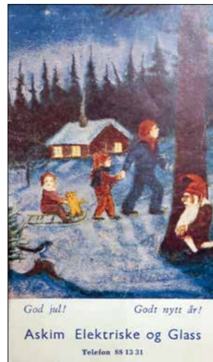
Marit Wesenberg har tatt vare på flere av de gamle julesangheftene fra sin egen barndom.