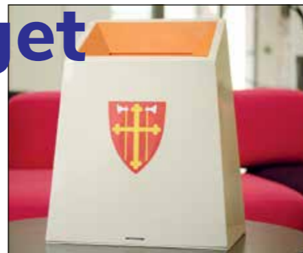
Valgurne for kirkevalget. (Kirkerådet).

bruke talentet ditt, bli kjent i nærmiljøet, legge til rette for kirka som kulturarena eller møteplass for barn og unge. Mulighetene er mange.