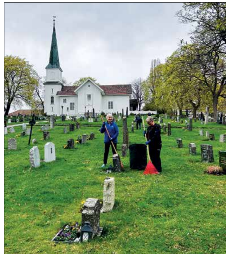
Dugnad på Nes gravplass 2025.