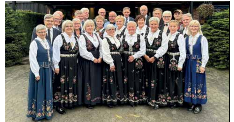
Gullkonfirmantene 2025 konfirmert i Nikolaikirken, Ål kirke og Grymyr kirke.

vil det være gudstjeneste i Moen kirke, her var det 31 konfirmanter i 1976. Samme dag blir det gudstjeneste i Nes kirke, her var det også 31 konfirmanter. Denne søndagen blir det også markering og feiring for gullkonfirman-