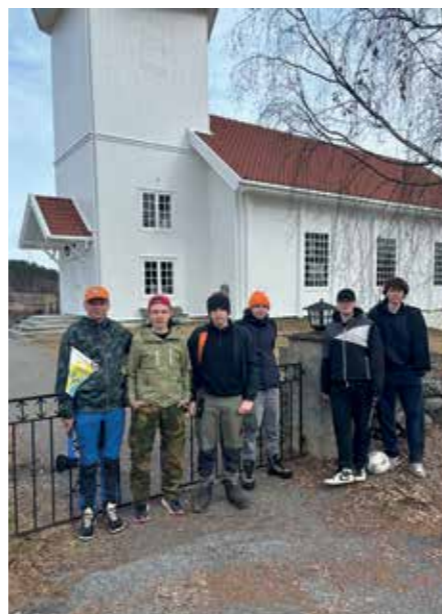
Årets konfirmanter i Bjoneroa foran porten til Sørums kirke.