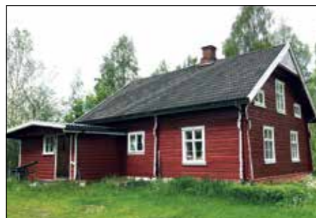
Gamle Hennung skole.

Søndag 14. juni kl. 13.00 er det gudstjeneste på Hennung skole. Velforeningen stiller opp med åpen kiosk, natursti og andre aktiviteter.