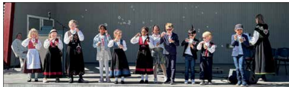
Størenslundens Søttendemaikor avsluttet sangopptredenen sin 17. mai 2025 med å blåse såpebobler.

I flere år har vi, som møter opp til gudstjenesten i Størenslunden i Brandbu kl. 11.00, hatt gleden av å lytte til Størenslundens Søttendemaikor. Dette er et barnekor med noen elever fra Brandbu barneskole. Elevene, som kommer fra forskjellige trinn, har hatt korøvelser de siste ukene før 17. mai.