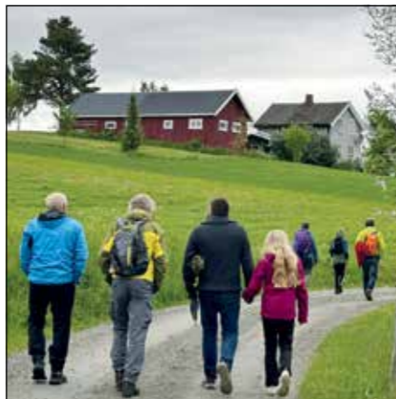
Vandring på Pilegrimsledens dag 2025.

7. juni markeres Pilegrimsledens dag i hele Norge og RiHaTo markerer åpning av pilegrimssesongen. Pilegrimsmesse kl. 18.00 i Søsterkirkene. Pilegrimssenteret holder åpent.