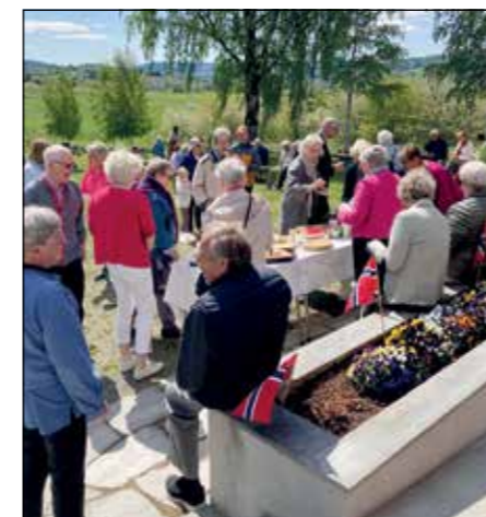
Det var et stort oppmøte under gudstjeneste og etterpå på kirkekaffe ute i det flotte pinseværet i 2023.

Nå er det snart pinseliljetid, og da feierer vi pinsen i to dager med felles gudstjenester for alle soknene. Søndag 24. mai med 1. pinsedag er det høytids-