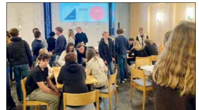
Her jobber konfirmantene med handelsspillet.