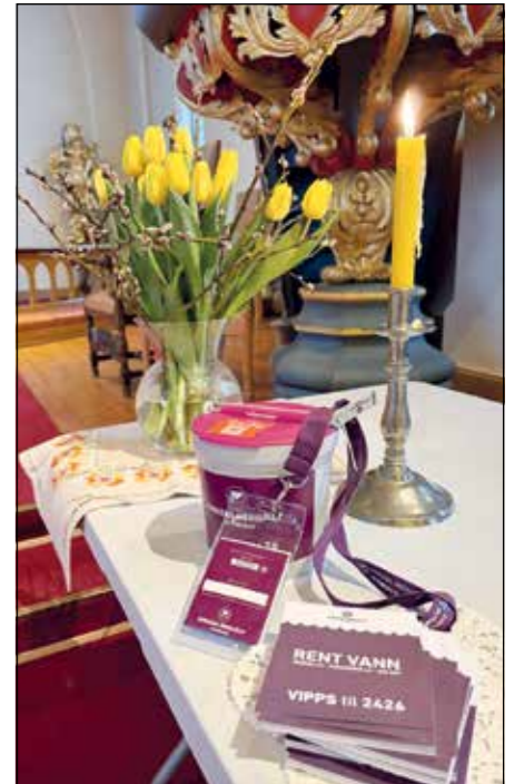
Fra konfirmanteres innsamlingsaksjon for Kirkens Nødhjelp i vår.