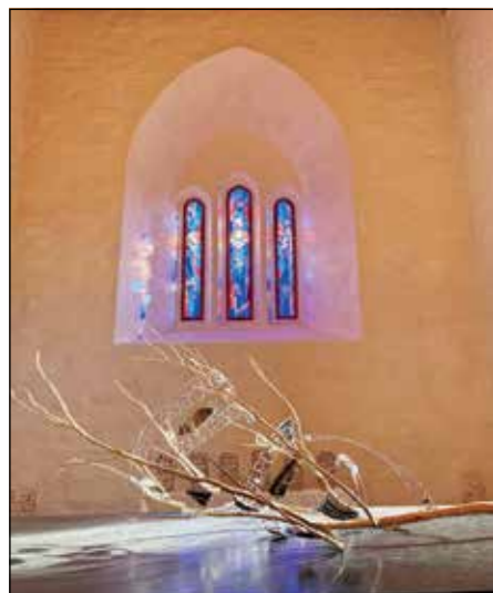
«Herrens velsignelse», verk av Grete Refsum.

For mer informasjon se www.kirken.no/gran