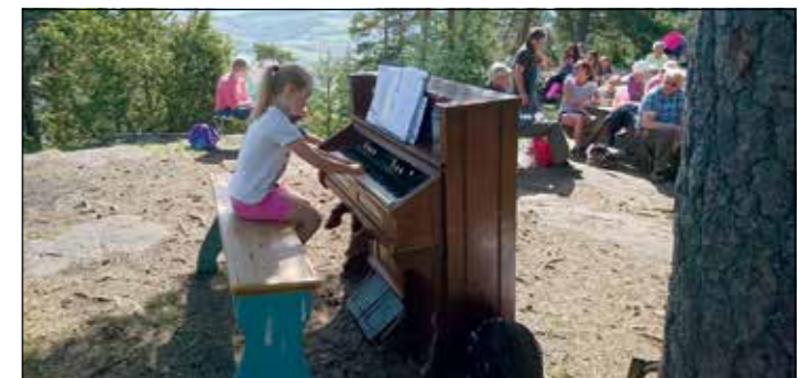
Et trøorgel på toppen av Sølvsberget må prøves. Her er det en av korjentene som prøver seg på tangentene.