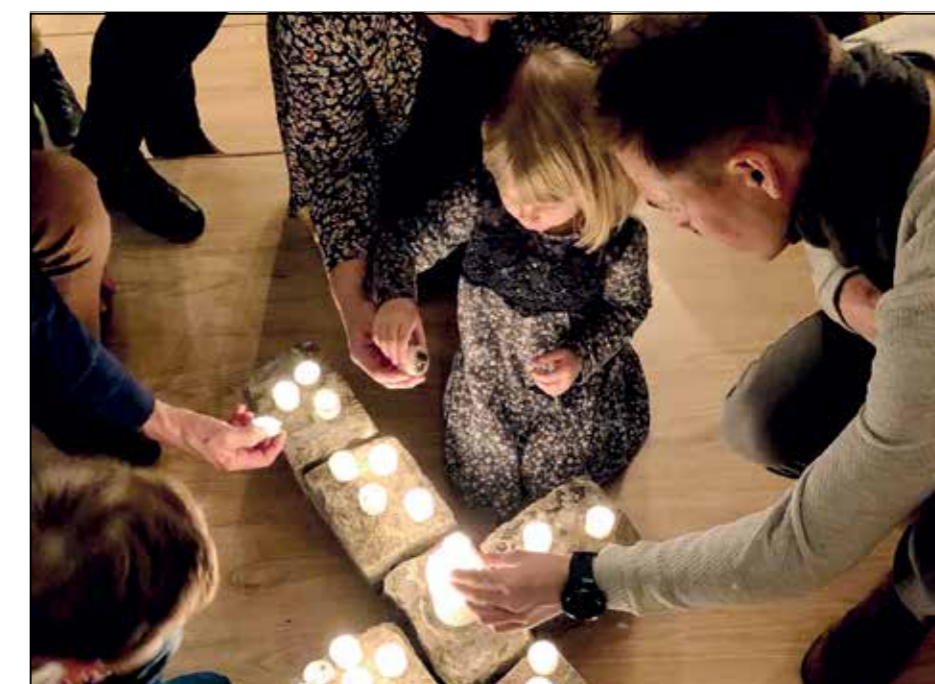
Første søndag i advent var det lystening på Søndags Liv som holder til på Jaren Misjonshus. Dette symboliserer at vi kan alle være med å tenne et lys, og at lyset fortrenger mørket. Jesus sa: «Jeg er verdens lys».