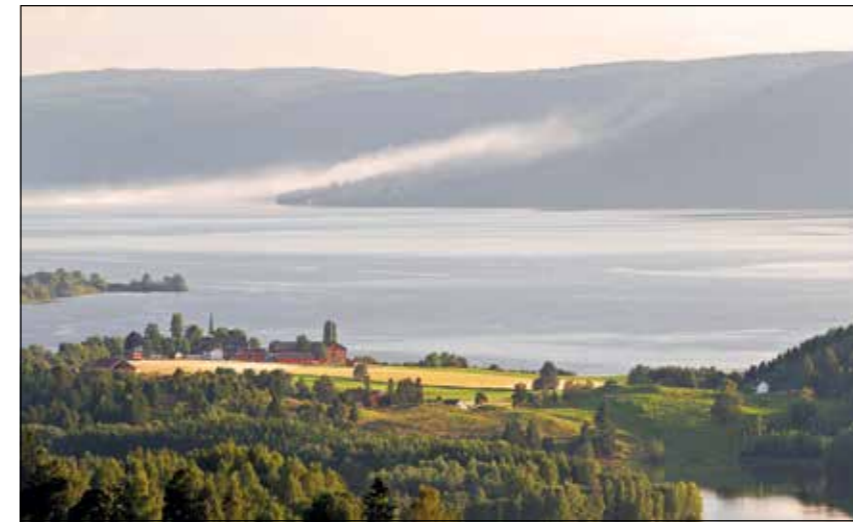
Utsikt fra Bleiken over Røykenvik.