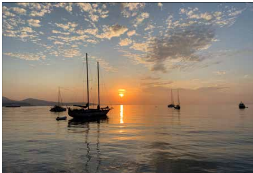
Soloppgang i Palmanova på Mallorca i august 2019.

Sjømannskirken går ut på å fullføre 10 nettbaserte brev. Temaene som jeg blant annet skal igjennom er: Konfirmanttiden, Bibelen, Tro og Tvil og Hva er et menneske. I forbindelse med hvert tema skal jeg gjennom videoer, bibelsitat og tekst før jeg svarer på ca. 10 spørsmål. Svarene sendes tilbake til sjømannspresten som er min kontaktperson. Presten går gjennom besvarelsene mine og kommer med kommentarer og