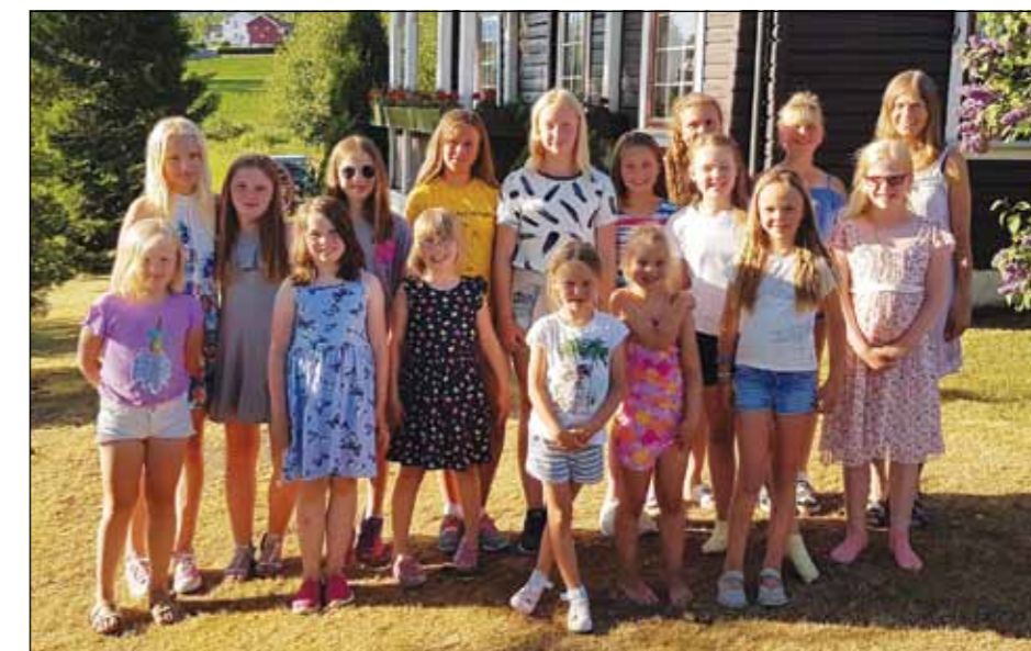
Korene Kormix og Brandbu Barne- og Ungdomskantori hadde sommeravslutning hos Bålerud Grimsbø 7. juni. Kormix holder til i Bjoneroa. De to korene har av og til konserter sammen, og da er det også hyggelig å ha en fest sammen. Kor-deltakerne kunne fortelle at det er veldig gøy å være med i kor. På korøvelsene synges det og spises popkorn, og derfor kalles det ene koret Popkorn. Når det er «korhelg» (weekend) er flere kor samlet til felles øving. Konsertene er også populære, for da får de unge vise tilhørerne hva de har lært. Hyggekvelden ble avsluttet med at fikk utdelt diplom, som takk for innsatsen!

Sanitetsforeningene i Gran sponser kirkeskyss og gir gratis drosje til gudstjeneste for de som har behov for skyss. For å komme til den nærmeste kirken med gudstjeneste, kan man bestille taxi gjennom drosjesentralen og be om at regningen sendes til sanitetsforeningen. Sentralen har oversikt over hvilken sanitetsforening som skal ha regningen. Spre gjerne denne informasjonen videre!