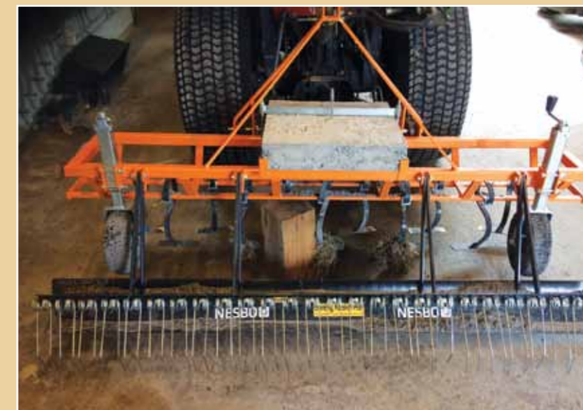
Grusharven vil pynte opp grusgangene i høst.