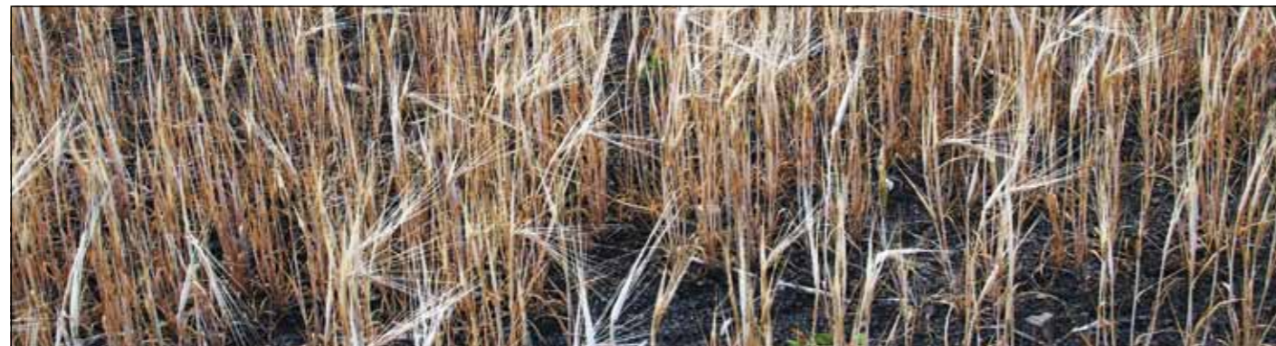
Bråmoden og skrinne åker sommeren 2018.

Men på forsiden av Kirkebladet bugner det av markens grøde. Bildet ble tatt da Ål kirke var pyntet til høsttakkefest i etterkant av sommeren 2017. Det er ikke selvsagt å ha et like velfyllt matfat etter årets tørkesommer. Men kanskje vi nå bedre forstår å takke for at vi fremdeles har mat, og for at vi bor i et land som har mulighet til å importere den maten befolkningen trenger.