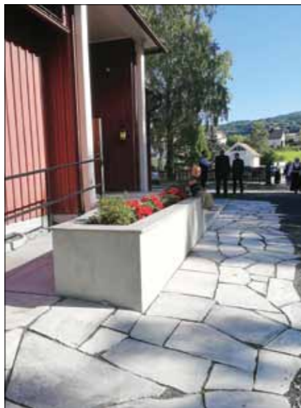
Ny rampe foran Ål kirke.