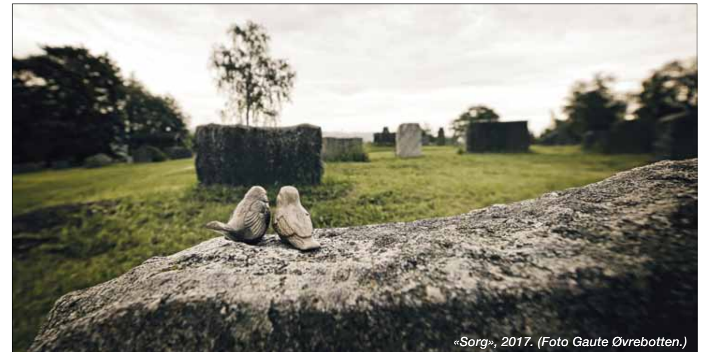
«Sorg», 2017.

Kilder: Atle Dyregrov og Kari Dyregrov: Mestring av sorg Utdrag av boka kan leses på nettstedet psykologisk.no