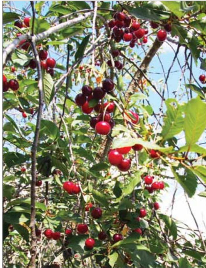
Kirsebærene hadde godt av det varme og tørre været sommeren 2018.

Vann er grunnleggende for alt liv og det har alltid vært viktig i de landområdene der Bibelen ble til. I Salmenes bok i det gamle testamentet står det om bekker av livgivende vann. Je-