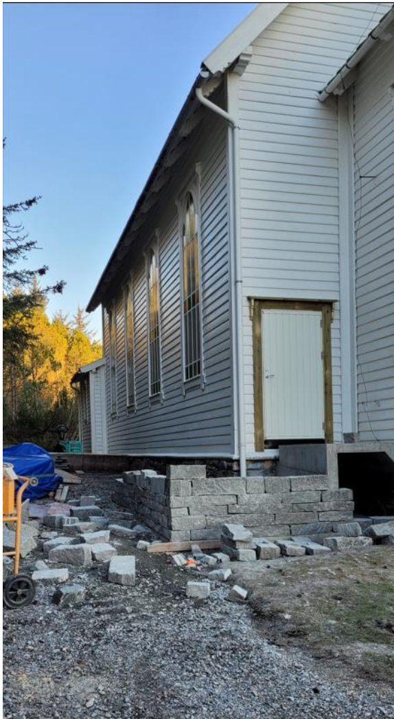
Arbeid med ny rullestolinngang

Resterande oppussing av bårhuset/toaletta er ferdig, og sjøve bårerommet har fått nytt golvbelegg. Det har vore synfaring for å sjå på le-plantinga på langsida av kyrkja, trea er etter kvart blitt høge, og det må gjerast tiltak så dei ikkje kjem borti kyrkja.