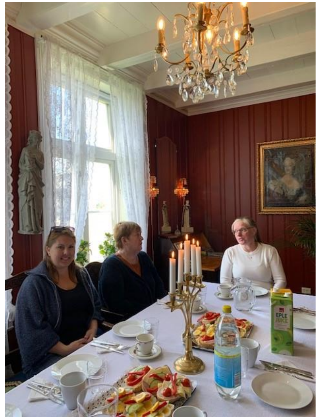
Gamle prestegarden i Selje