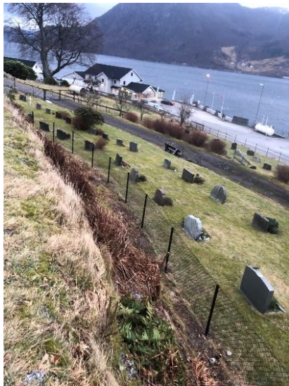
Nytt gjerde mot gravplass