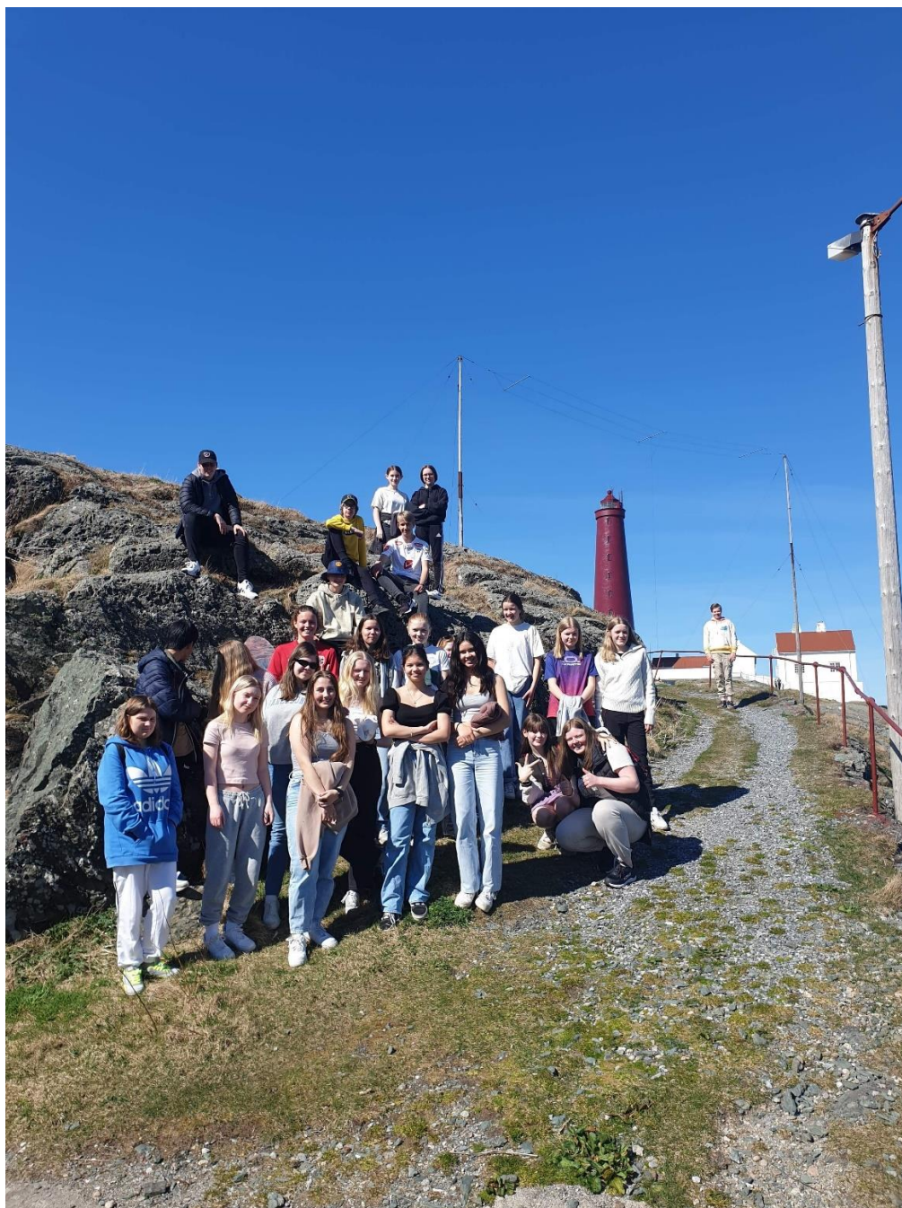
Konfirmantane i Gulen og Solund på tur til Utvær april-22.