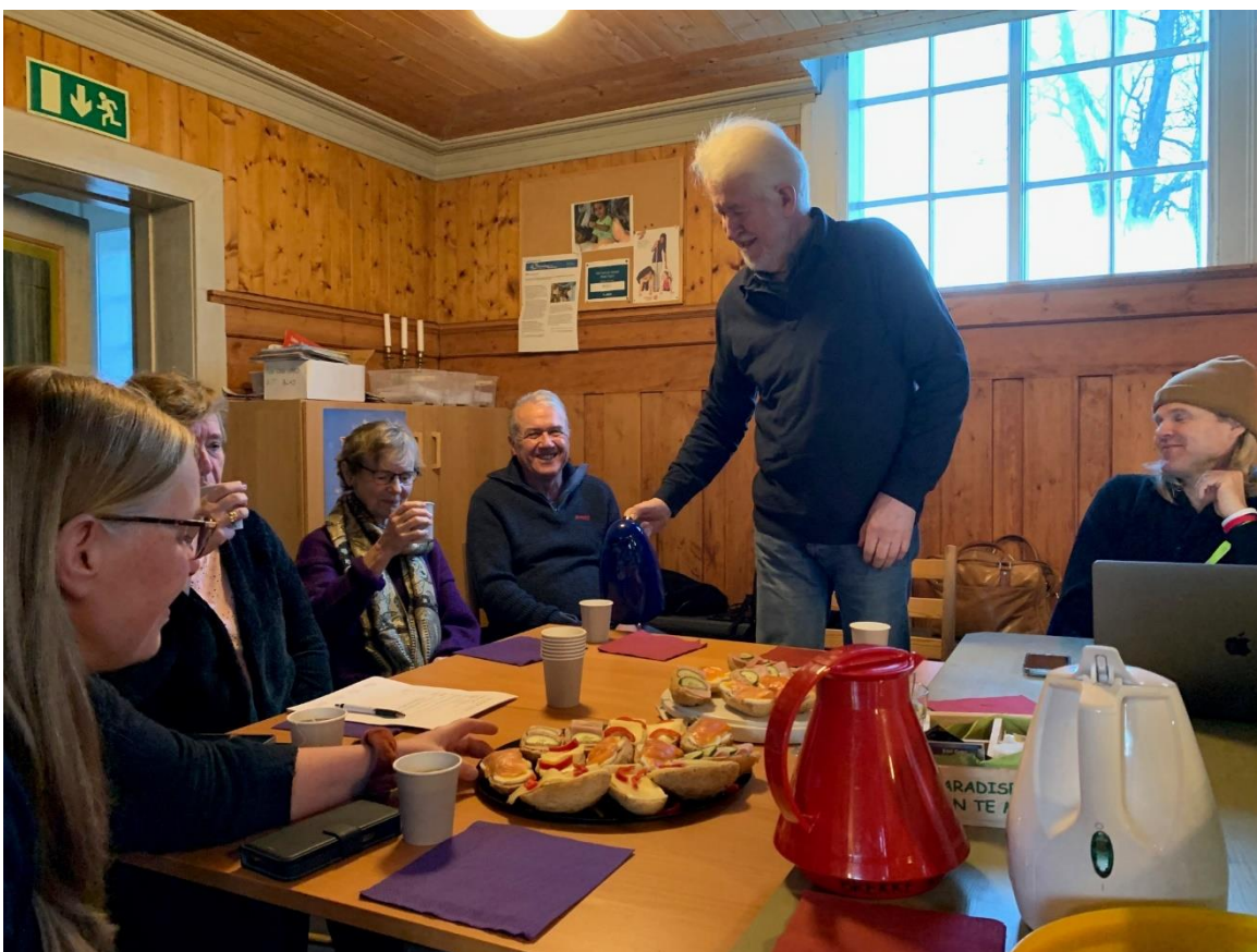
Bilete frå møte i Gulen kyrkjelege råd

GKR søkte Bjørgvin bispedømmeråd om godkjenning av ordninga med felles sokneråd som permanent etter å hatt saka til høyring på soknemøte i alle tre sokna, der det blei gitt full tilslutning til framlegget frå GKR. Valordninga blir som i dag, med 2 medlemar og 3 varamedlemar frå kvart sokn i GKR, samt geistleg representant. Gulen kyrkjelege fellesråd har same samansetjing, supplert med ein kommunal representant. Ordninga med lokale sokneutval vert vidareført. Søknaden blei innvilga i januar 2023.