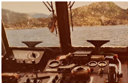
Utsikt frå styrehuset på Tinganes, 1979.

Etter 20 minutt med ein rask båt var eg framme ved bedehuskapellet. Dei fleste som skulle delta i gravferda, var allereie samla i storsalen. Men presten skulle ikkje direkte dit. Først vart det dekkja på med mat for presten i veslesalen. Slik hadde det alltid vore, forstod eg. Eg må seie det kjendest ganske rart for ein alminnelig bondegut frå Lavikdalen plutseleg over natta å bli teken imot som han «far», sjølvaste soknepresten. Der sat eg åleine i veslesalen og prøvde å få ned ein matbit. Ikkje fordi eg var svolten og trong mat, men fordi det var tradisjon.