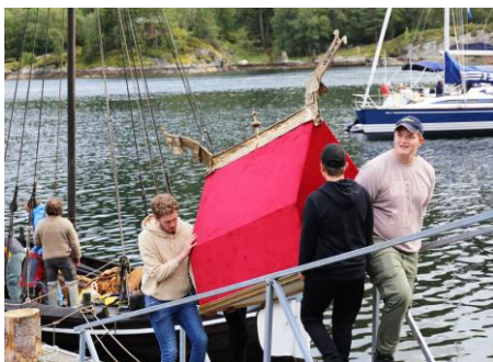
Sterke konfirmantar ber Sunnivaskrinet frå jekta og opp til Gulen kyrkje

Konfirmantane var med og lagde til ei flott pilegrimsgudsteneste knytta til Sunnivaseglen frå Selja til Bergen.