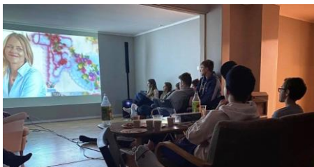
Frå pizza-/kinokvelden i prestebustaden

Ein planlagt pizza- og kinokveld måtte avlyst på grunn av Covid-19.