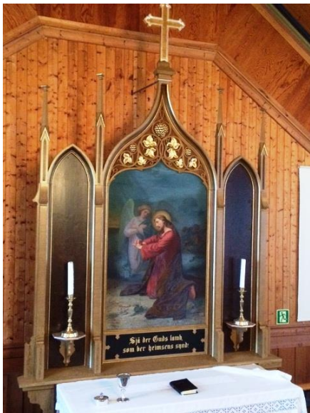
Altartavla i Brekke