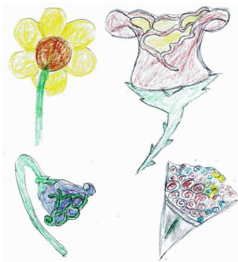
Teo Arefjord, 9 år